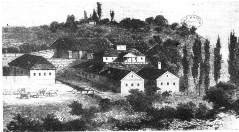
Рис. 1. Фрідешівський завод. 1863 р. Малюнок А. Шоссела

Саме тут почали виготовляти перші вироби художнього литва – залізні і чавунні грубки, прикрашені рельєфним ажурним орнаментом. Ці заводи й принесли заслужену славу закарпатському художньому литву. Сьогодні у колекціях Закарпатського краєзнавчого музею зберігається близько 300 оригінальних виробів художнього і декоративно-прикладного литва залізничних заводів області. Серед них вирізняється встановлена на подвір'ї музею могутня скульптура Геракла, який вбиває лернейську гідру. Той факт, що окрім предметів домашнього вжитку, знарядь праці згадані заводи на території області виливали і предмети художнього литва, підтверджується і каталогами, виданими у 20-му столітті, які теж збережені в історико-краєзнавчому музеї області, а також матеріалами угорської промислової виставки 1842 р., на якій вироби Шелестівського заводу одержали золоту медаль. Деякі з них пов'язані з іменем формувальника і скульптора Вілашека – слави Фрідешівського заводу (з 1848 р.) та скульптора Андраша Шоссела – учня знаменитого Будапештського скульптора Ференца Угрі (у 1843–1847 рр. він працював у майстерні Віденської академії мистецтв під керівництвом Кегсмана Гунделя та Вінсенса Неулінга). На виставці у Відні у 1873 році його знамениті шахові фігури (виготовлені в 1860 р.) були удостоєні премії.