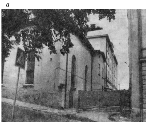
Рис. 3. Театрально-видовищні споруди у Львові, в яких виступали єврейські театри: а) товариство “Яд Харузім”; б) театр “Колізей”; в) товариство “Гвезда”