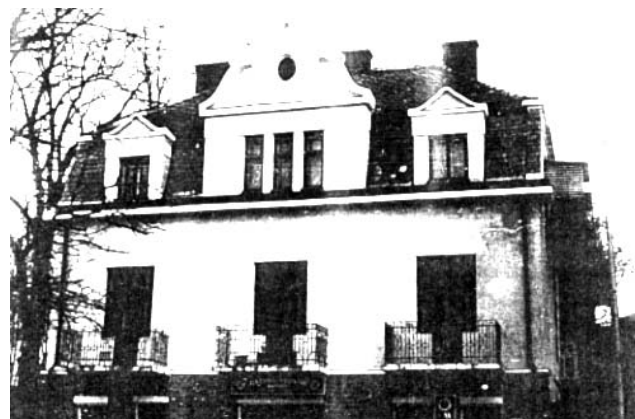
Рис. 4. Вілла “Щасти, Боже”.