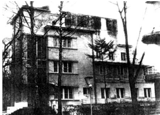
Рис. 6. Пансіонат “Віндзор”.

У 20–30-і рр. ХХ ст. у курортній забудові Галичини поширюється модернізм (функціоналізм), який виникає на зміну історичних та народних стилів в архітектурі. На ґрунті перших проявів глобалізації економіки капіталізму, які в нашому регіоні виникли через переплив американського капіталу після першої світової війни на європейські ринки, виник новий стиль – модернізм, що базувався на розвитку техніки і промислового будівництва. В архітектурі запанував раціональний підхід, викликаний захопленням сучасними методами виробництва, який спричинив перехід від народного традиціоналізму до модернізованого стилізаторства [1].