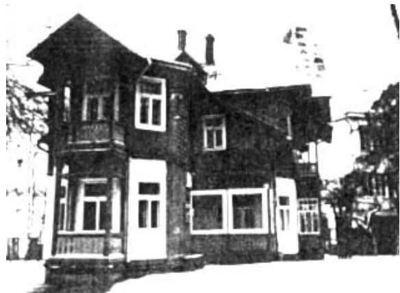
Рис. 2. Вілла “Великий косинір”.