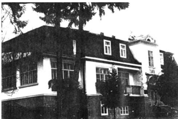
Рис. 3. Вілла “Здоров’я”.