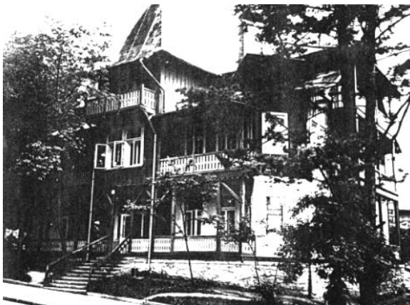
Рис. 1. Вілла “Софія”.

Прикладом цього явища є розвиток архітектурної форми “закопанського” стилю як різновиду польського національного модерну. Цей стиль виник у середовищі патріотичного руху Молодої Польщі (Młodej Polski) як реакція на поширення “германського” стилю (зокрема, “швейцарського” та “норвезького”) у карпатських здравницях. Основним ідеологічним підґрунтям “закопанського” стилю була також спроба солідаризувати різні верстви польського суспільства всупереч впливам соціалістичних ідей, які панували тоді в європейській еkleктичній архітектурі.