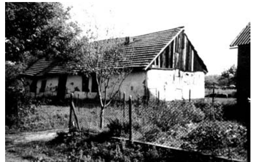
Рис. 4. Житловий будинок в колонії Фалькенштайн (Соколівка). Сучасний стан