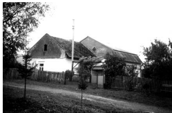
Рис. 11. Колонія Брігідау (Ланівка). Наступ новобудов на колишній садиби

Сьогодні деякі хати в окремих колоніях використовують як дачі. Ось тоді й “оживають” такі об’єкти. Більшість будинків, що збереглись, знаходяться в аварійному стані (рис. 8). Але існують і винятки. Так, в колоніях Нова Митниця, Дорнфельд, Найдорф, Угартсталь та деяких інших окремі будин-