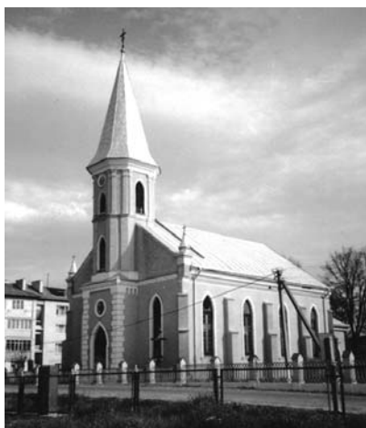
Рис. 2. Кірха в колонії Брігідау (Ланівка)

безкоштовно землю, худобу, будівельні матеріали тощо. Для німців-поселенців виділялись добрі сільськогосподарські угіддя, кращі ґрунти. Німці отримали багато пільг порівняно з місцевим населенням. У формуванні державного апарату управління Галичиною надавалась перевага німецькомовному населенню.