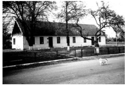
Рис.3. Адмінбудинок (пошта, поліція) в колонії Брігідау (Ланівка)

Садиби поселенців були досить великими домогосподарствами (розміри сягали 30–40 м в ширину і до 100 м і більше в глибину ділянки. Городи були обов'язковими елементами садиби. Крім хати садибу формували розташовані навколо господарського двору стайня, стодола, шпихлір, криниця, погріб (рис. 5). У найбільш заможних господарів обійстя нагадувало фермерське господарство, в якому використовували найману робочу силу. Залишки таких господарств зустрічаємо в колоніях Дорнфельд (Тернопілля), Вайсберген (Біла Гора), Брундорф (Керниця) тощо. Наприклад, в колонії Брундорф господарське подвір'я утворювали три великі стайні та пара стодол. Стайня, що збереглась до наших днів, має розміри 10×43 м. За цими будівлями знаходилися поля-пасовища.