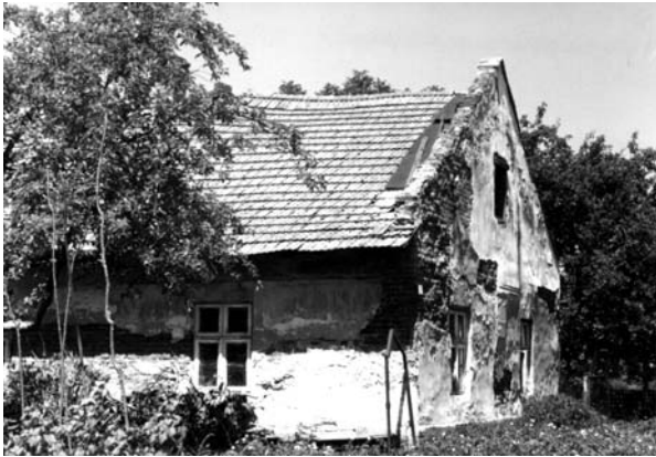
Рис. 8. Житловий будинок в колонії Розенберг (Щирець). Сучасний стан

Не маючи в нових умовах достатньої економічної мотивації існування, колонії почали швидко занепадати і в історично короткий відрізок часу припинили своє існування як самодостатній елемент розселення. Колись розкішні села, що налічували понад тисячу мешканців – Йозефсберг, Кьонігсау, Дорнфельд та ін. – кожне з садами, попівством, школою, кузнею, маслобійнею сьогодні перетворились на хутори, де живе близько 40–50 сімей, або злились із найближчим населеним пунктом, або поступово зникли. Наприклад, від таких колоній, як Еренфельд (Чистопілля), Ебенау (Стоділки), Мосберг (Підлужи Великі) та ін. залишилась лише згадка. Одні з них щезли під час воєнних дій (Еренфельд), інші занепали внаслідок відтоку робочої сили до великих міст (Йозефсберг, Кьонігсау, Розенберг, Візінберг та ін.). Кожна колонія має свою історію занепаду. Сучасне молоде покоління населених пунктів, які колись були колоніями, часто і не знає про таку сторінку в історії їхнього села, як німецькі колонії.