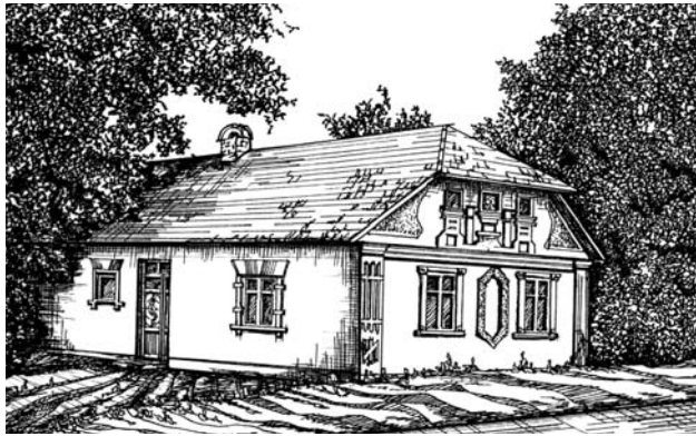
Рис. 6. Житловий будинок в колонії Кайзердорф (Калинів)

На початок ХХ ст. досить вагому частку заможного населення краю становлять німці-колоністи. Серед них вирізняється клас заможних господарів і підприємців-початківців. Та й деякі поселення вважаються багатими, заможними: колишні Дорнфельд (Тернопілля), Йозефсберг (Коросиця), Брігідау (Ланівка), Кайзердорф (Калинів), Найдорф (Нове село) тощо. Колонії розвиваються та економічно міцніють аж до початку Другої світової війни.