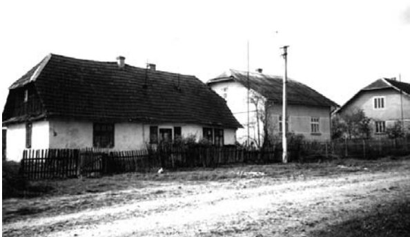
Рис. 10. Колонія Кимир. Приклад розбудови своєї половини будинку однією із сімей