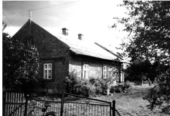
Рис. 9. Житловий будинок в колонії Дорнфельд (Тернопілля). Сучасний стан