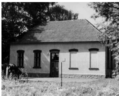
Рис. 1. Школа в колонії Ебенау (Стоділки)

У кінці XVIII ст. Галичина, що потрапила під владу Австрії, зазнала потужної хвилі міграції німецьких колоністів. Заселення німецькими переселенцями Галичини і створення німецьких колоній австрійським урядом мало на меті економічне піднесення краю і, безперечно, додаткове поповнення державних прибутків. Були і певні розрахунки відносно германізації цих земель. Німці-переселенці мали стати міцним ядром підтримки імперської політики на теренах захоплених східних територій. Оскільки влада хотіла бачити на галицьких землях міцного селянина-господаря, австрійська програма міграції німців в Галичину передбачала значне інвестування з державного бюджету. Мігранти отримували гроші, харчі на дорогу, а з прибуттям на місце поселення –