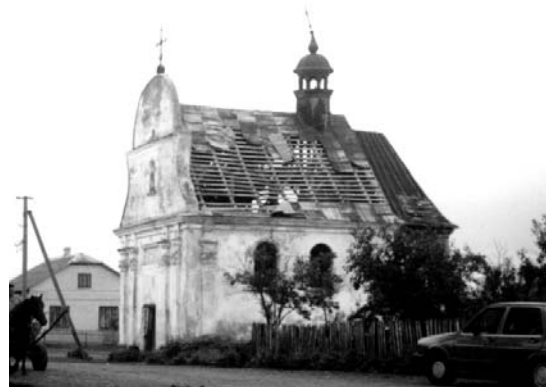
Рис. 7. Костел в колонії Корсів (сучасний стан)

У лютому 1940 р. німці-колоністи у примусовому порядку були переселені на захоплені Німеччиною західні території Польщі. Ініціатива переселення німецьких колоністів з України належить Берліну. Переселенці мали поповнити трудові ресурси Рейху. Крім цього, німецьку молодь чекала служба у вермахті та військах СС у спецпідрозділах, де були потрібні знання української, польської мови, умов життя і психології місцевого населення.