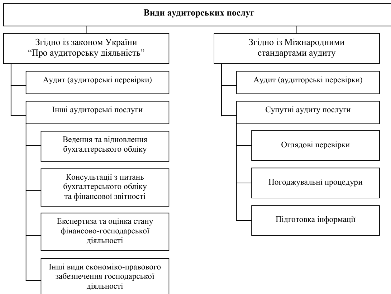
Рис. 1. Види аудиторських послуг

Розвиток ринкових відносин зумовлює сьогодні розширення трактування аудиту не тільки з позиції перевірки бухгалтерської та фінансової звітності, але й перевірки ефективності здійснення різних сфер економічної діяльності підприємства. Зокрема, за останні роки на підприємствах виникає необхідність проведення перевірки логістичної діяльності в категоріях витрат, використання запасів та обслуговування клієнтів, що зумовило формування нового напрямку аудиту – аудиту логістики.