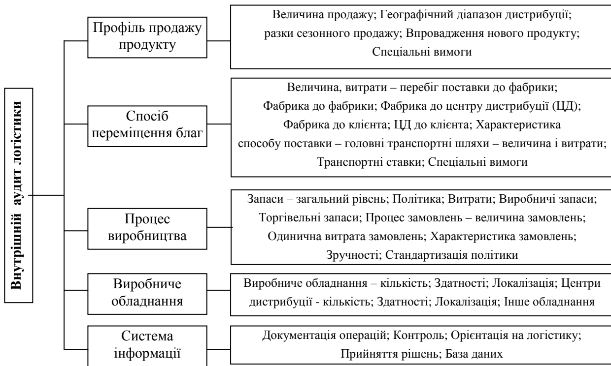
Рис. 3. Елементи внутрішнього аудиту логістики