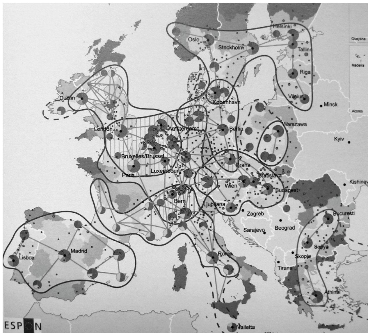
Рис. 2. Приклади зон інтеграції зростаючих потенціалів метрополісів на території ЄС

У 70 роках зміни в технологіях виробництва, прогрес на транспорті, розвиток телекомунікацій та інформаційних систем стали ознаками формування постіндустріального суспільства. Під впливом вищевказаних чинників відбувається функційна перебудова колишніх промислово-розподільчих центрів у центри управління, інформації й обслуговування що зумовило зміни в соціально економічній та урбаністичній структурі міст. Великі міста, міські агломерації, урбанізовані райони все більше стають місцем зосередження невиробничих підрозділів компаній, наукових і управлінських установ, спеціалізуючись на виконанні контрольних-управлінських функцій та забезпеченні ділових послуг у масштабах цілого світу, розвиваючись під впливом світових економічних процесів глобалізації.