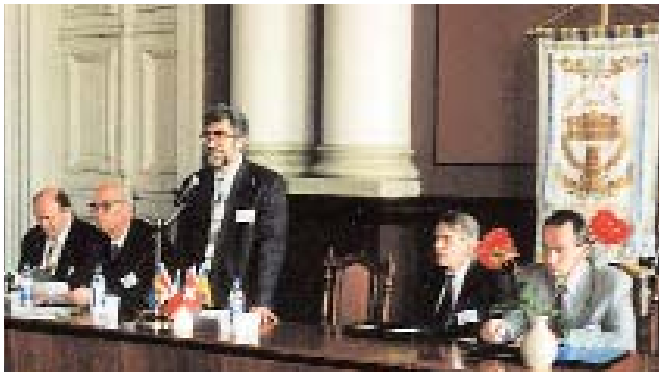
Відкриття міжнародної науково-технічної конференції