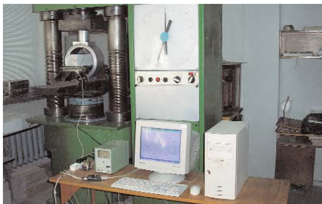
Загальний вигляд випробувальної установки дослідження тріщиностійкості дорожніх бетонів методами механіки руйнування