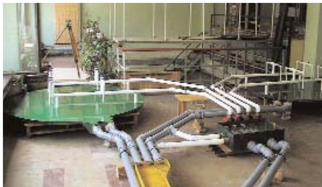
Фізична модель системи оборотного водопостачання АЕС

При кафедрі з 2008 року діє Центр інженерії доквілля та водокористування, створений спільно з компанією Josa Ingenieria y Construcciones, S.A. (Іспанія).