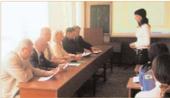
Захист дипломних робіт студентами-випускниками кафедри

Упродовж 2002–2008 рр. викладачами підрозділу видано 6 підручників, 33 навчальні посібники, з них 9 з грифом Міністерства освіти і науки України. Усі курси, які читаються на кафедрі, мають відповідне методичне забезпечення, зокрема за час існування кафедри видано 144 методичних видань і конспектів лекцій. У подальшому удосконалюється їх зміст, структура, готуються методичні рекомендації до нових дисциплін. Для проведення наукової, методичної та навчальної роботи кафедра забезпечена комп'ютерною і копіювальною технікою.