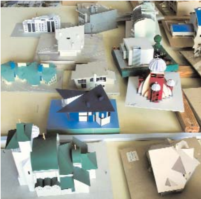
Макети проектів, студентські роботи

школи і вдало поєднував педагогічну діяльність із проектуванням та будівництвом.