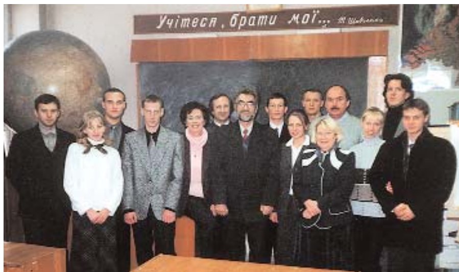
Викладачі кафедри фотограмметрії та геоінформатики зі студентами