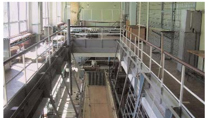
Комплексна лабораторія гідравліки і сантехніки