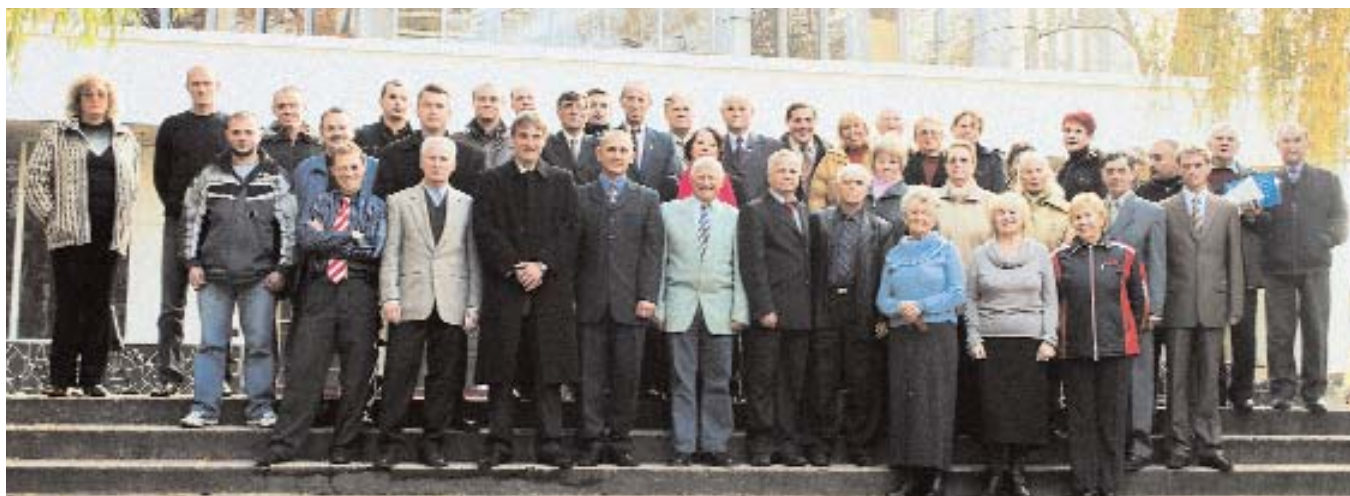
Викладачі кафедри фізичного виховання

Викладачі кафедри проводять чемпіонати серед інститутів університету з 22 видів спорту та культивують 41 вид спорту. У спортивних секціях займається близько 900 студентів. Групи здоров'я з різних видів спорту об'єднують майже тисячу студентів. Збірні команди університету виступають у 38 видах спорту на Універсіадах Львівщини та в 29 видах спорту на Універсіадах України.