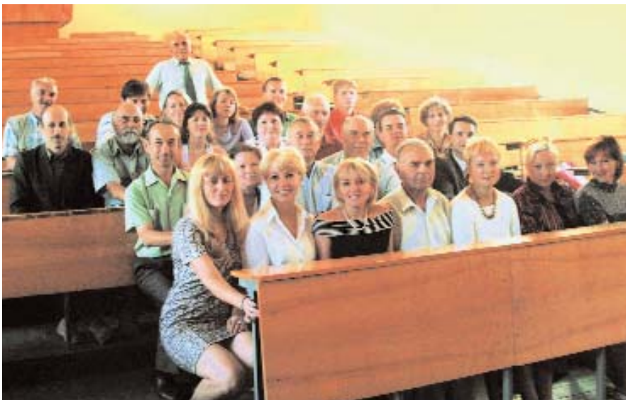
Викладацький колектив кафедри психології, педагогіки і права

з проектом «Реформування соціальних служб», котрий фінансувався Відділенням Центральної і Східної Європи Канадського агентства міжнародного розвитку (CIDA)). У 2000 р. цю роботу передано новоствореній кафедрі соціології та соціальної роботи. З 2003 р. кафедра психології, педагогіки і права здійснює підготовку магістрів для потреб системи освіти України за спеціальністю «Управління навчальним закладом». У 2007–2008 навчальному році кафедра випустила 46 магістрів із цієї спеціальності (22 студенти стаціонарно, 24 студенти заочно) і 1 екстерн.