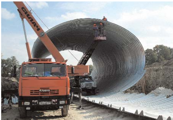
Монтаж металевої труби на автомобільній дорозі Київ — Львів

Науковий напрям докторанта, доцента кафедри С. Й. Солодкого — механіка руйнування бетонів на модифікованих цементах. Під його керівництвом захищено 2 кандидатські дисертації. Йому належить понад 80 наукових праць.