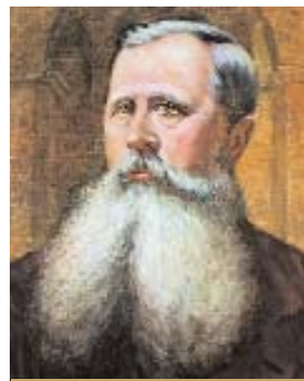
Ю. Захарієвич, професор архітектури, ректор 1877–1878, 1881–1882 рр.

Автор головного корпусу Політехніки відіграв важливу роль у розвитку цього навчального закладу. Юліан Захарієвич народився 17 липня 1837 р. у Львові, у родині вірменів. Він закінчив Львівську технічну академію, а згодом керував тут кафедрою будівництва із 1871 р. аж до своєї смерті (27 грудня 1898 р.). Очоливши цю провідну кафедру у віці 34 років, він понад чверть століття творчо готував архітекторів. Ю. О. Захарієвича обирали деканом архітектурного факультету і ректором Політехніки. Він зробив дуже вагомий внесок у розвиток Львівської архітектурної