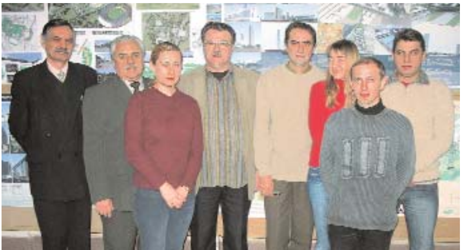
Колектив кафедри дизайну архітектурного середовища.

Кафедра забезпечена висококваліфікованими кадрами. При ній працює науково-дослідна лабораторія.