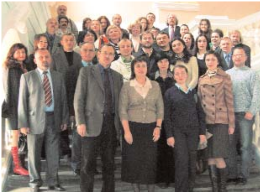
Колектив кафедри дизайну та основ архітектури

Головне завдання кафедри — навчити майбутніх архітекторів адекватно розуміти сутність предмету архітектури, прищепити їм здатність володіти принципами й методами архітектурної композиції, а також забезпечити належний рівень підготовки студентів в мистецькому аспекті. На кафедрі зосереджені основні лекційні курси з історії архітектури та мистецтва. Крім того, що кафедра здійснює спеціалізовану професійну підготовку майбутніх архітекторів, вона очолює також навчання студентів за спеціальністю «Дизайн».