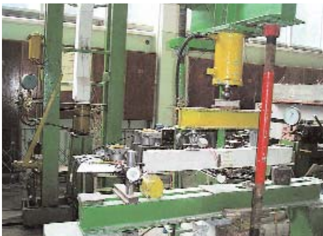
Навчально-наукова лабораторія випробування будівельних конструкцій

Розвинута матеріальна база лабораторії, що включає найсучасніші комп'ютерні технології, унікальні випробувальні стенди та обладнання загальною вартістю понад 1 млн. гривень дозволяє на найвищому рівні та в стислі терміни виконати вказані роботи. Висококваліфікований колектив з величезним досвідом має в своєму доробку проектування підсилення Оперного театру та драмтеатру ім. М. Заньковецької, інших пам'яток архітектури, несучих конструкцій пам'ятників Т. Шевченку й працівникам міліції, що загинули при виконанні службового обов'язку, та багато інших.