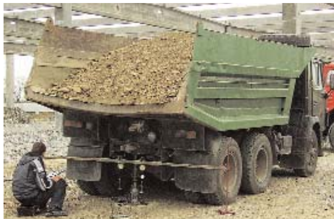
Натурні експериментальні дослідження штучної основи, підготовленої під покриття підлоги торгового центру «Арсен» (м. Стрий Львівської області)