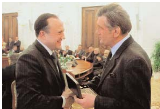
Вручення З. Бліхарському президентом України В. Ющенком Державної премії України в галузі архітектури, 2007 р.

В інституті створені належні умови для підготовки фахівців, які відповідають вимогам сучасного будівництва,