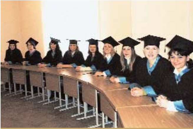
Перший випуск магістрів соціальної роботи

кадрового потенціалу, інформаційного та матеріального забезпечення інституцій з метою практичної підготовки студентів під час проходження ними різних видів практики, а також засвоєння дисципліни «Навчально-дослідницький практикум». З іншого боку, кафедра надає цим закладам — базам практики — науково-методичну допомогу шляхом підвищення кваліфікації їхніх працівників на відкритих модульних курсах професійного навчання. За період з 1999 р. було проведено понад 10 двотижневих курсів для близько 200 представників із 50 державних і громадських організацій, що надають соціальні послуги, з метою підготовки супервізорів — керівників навчальної практики студентів. А із січня 2004 р. розпочав свою роботу постійно діючий міжнародний семінар з питань професійного розвитку фахівців соціальної сфери.