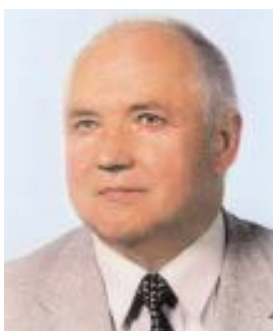
Є. В. Крикавський, професор

Упродовж 1993–2006 рр. Є. В. Крикавський сформував новий науковий напрям в економічній науці — логістику — і є визнаним авторитетом. Під його керівництвом захищено понад 23 дисертацій, з них 2 докторські. Він автор 12 підручників і навчальних посібників з грифом