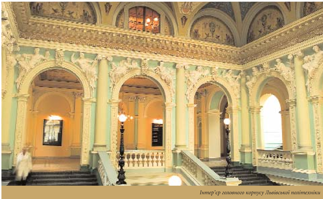
Інтер'єр головного корпусу Львівської політехніки