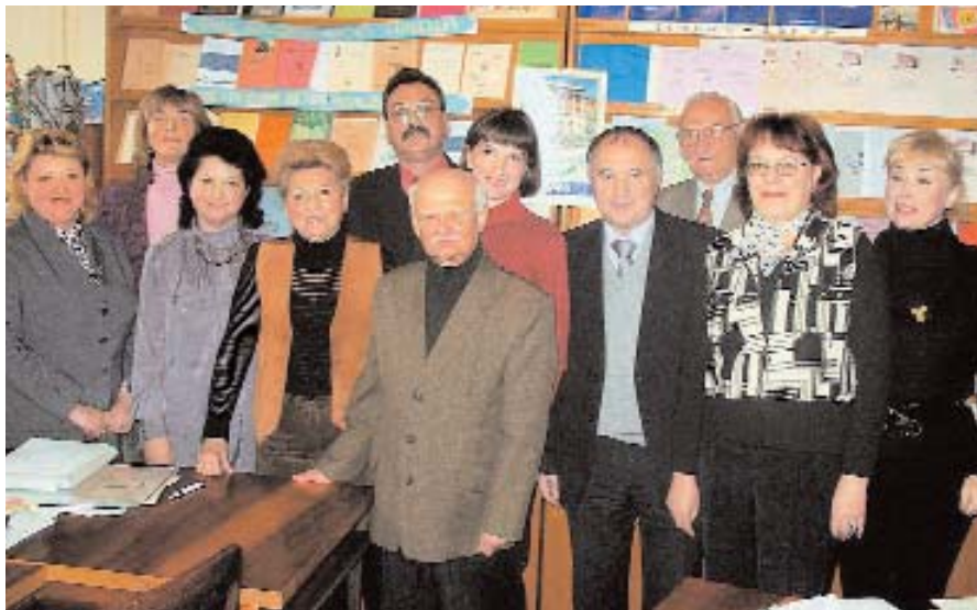
Провідні викладачі кафедри іноземних мов.

На базі підрозділу в 1998 р. створено нову кафедру прикладної лінгвістики, до якої делеговано 6 кандидатів наук, доцентів; два викладачі кафедри іноземних мов пройшли 3-річне стажування в Канаді і після навчання працюють на кафедрі