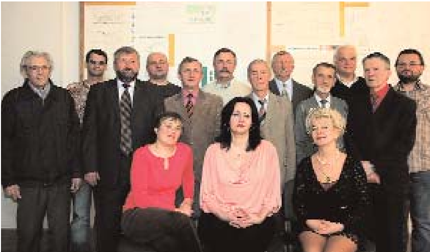
Колектив кафедри архітектурних конструкцій.