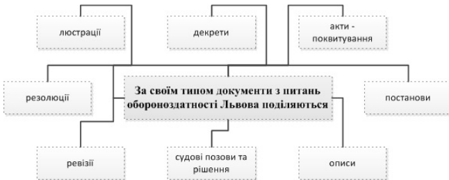
Рис. 1. Класифікація документів з питань обороздатності Львова

Варто зазначити, що найбільший та найповніший масив джерел становлять документи Львівського магістрату за період другої половини XIV–XVIII ст. На сьогодні дана група джерел є добре збереженою, знаходиться в Центральному державному історичному архіві в м. Львові, де складає окремий фонд № 52 – “Магістрат міста Львова”. Даний фонд включає два описи та 2315 справ [1]. Ці матеріали охоплюють період другої половини XIV–XIX ст. Матеріали, що стосуються військової справи у Львові, розвитку і становища міських укріплень містяться у першому описі фонду. За своїм типом та формуляром – це різноманітні документи, які стосуються історії міста (Рис. 1).