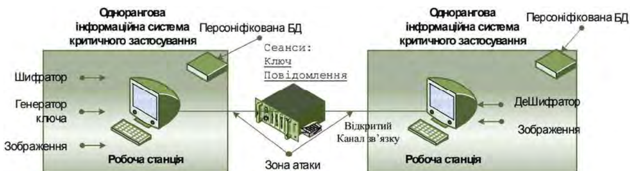
Рис. 3. Схема реалізації технології захисту растрових зображень в одноранговій мережевій автоматизованій системі

Отже, внаслідок виконання дослідження вирішено актуальну науково-прикладну задачу, яка полягає у розробленні підходу до модифікації алгоритму RSA з використанням бінарних афінних перетворень, що дає змогу зберегти його стійкість до дешифрування зображень, забезпечить повну їх зашумленість, а також унеможливить використання методів їхнього візуального оброблення.