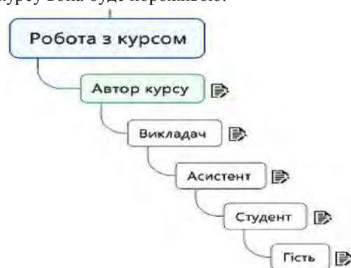
Рис. 4. Дерево керування курсом

вість обрати викладачу логін та пароль для входу в систему. Після входу в систему Moodle викладач побачить перелік курсів дисциплін, доступних йому для редагування. Для початку роботи необхідно обрати курс в блоці "доступні курси" і клікнути мишею на його назві. Якщо викладач вперше заходить на сторінку навчального курсу вона буде порожньою.