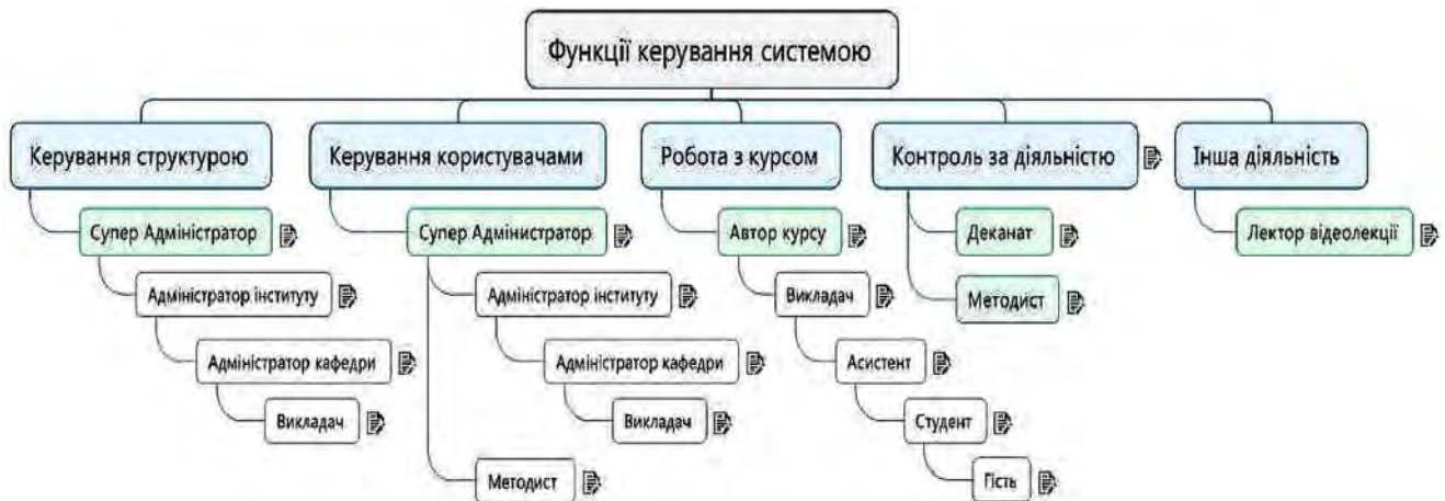
Рис. 1. Дерево розподілу ролей в системі LMS Moodle

За іншим підходом адміністрування ролей в системі LMS Moodle умовно можна поділити так, як це показано на рис. 1.