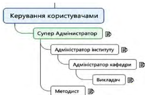
Рис. 3. Дерево керування користувачами

Викладач: прикріплює студентів до навчальних дисциплін.