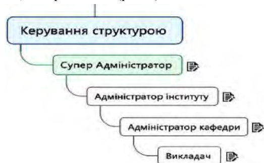
Рис. 2. Дерево керування структурою

між собою в сталих відношеннях, що забезпечують їх функціонування й розвиток як єдиного цілого. Елементами структури є окремі користувачі – викладачі та студенти, служби та інші ланки апарату управління, а відношення між ними підтримуються завдяки зв'язкам, що прийнято поділяти на горизонтальні й вертикальні. Горизонтальні зв'язки мають характер погодження й є, як правило, однорівневими (рис. 2).