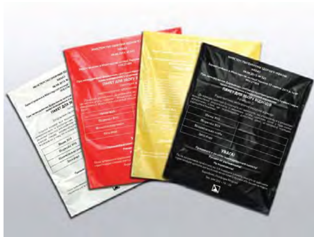
Рис. 1. Пакети для збору та утилізації медичних відходів

Для безпечної утилізації медичних відходів 4 класів небезпеки використовують різноманітні кольорові пакети для їх збору, які зображені на рис. 1.