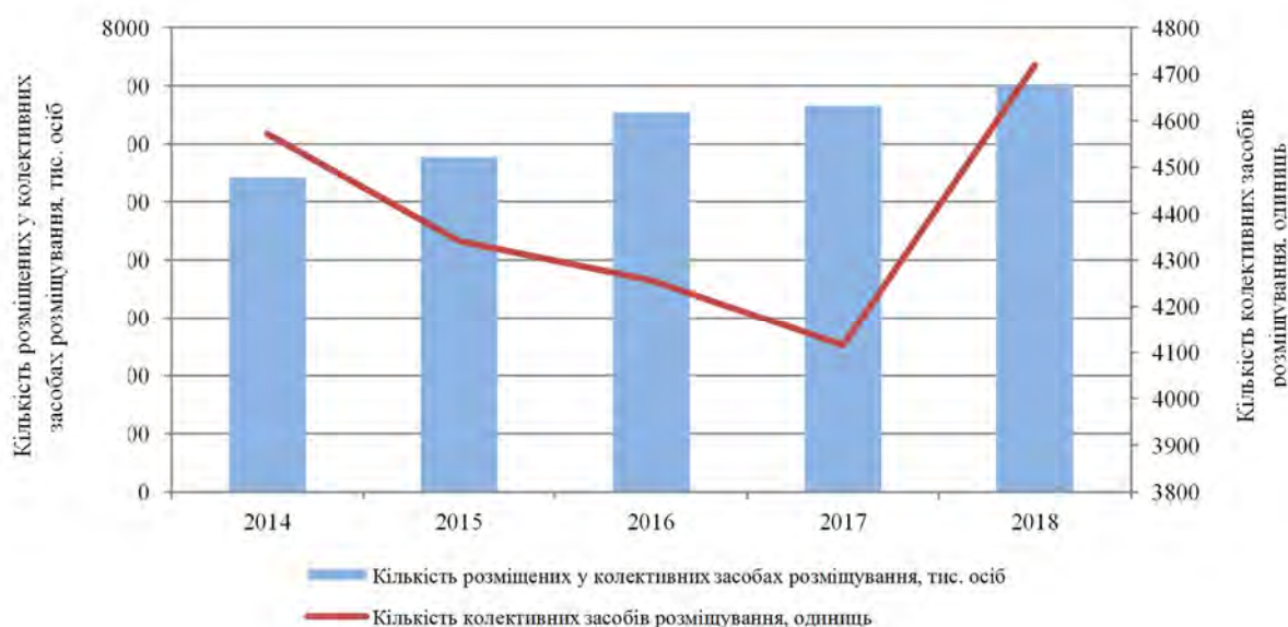
Рис. 2. Динаміка кількості колективних засобів розміщування в Україні та кількості осіб, які у них розміщені

2018 р.). На фоні зменшення кількості КЗР протягом 2014–2017 рр. спостерігаємо зростання кількості розміщених у КЗР (з 5423,9 тис. осіб у 2014 р. до 6661,2 тис. осіб у 2017 р. (+22,8 %) та 7006,2 тис. осіб у 2018 р. (+29,2 %) (див. рис. 2).