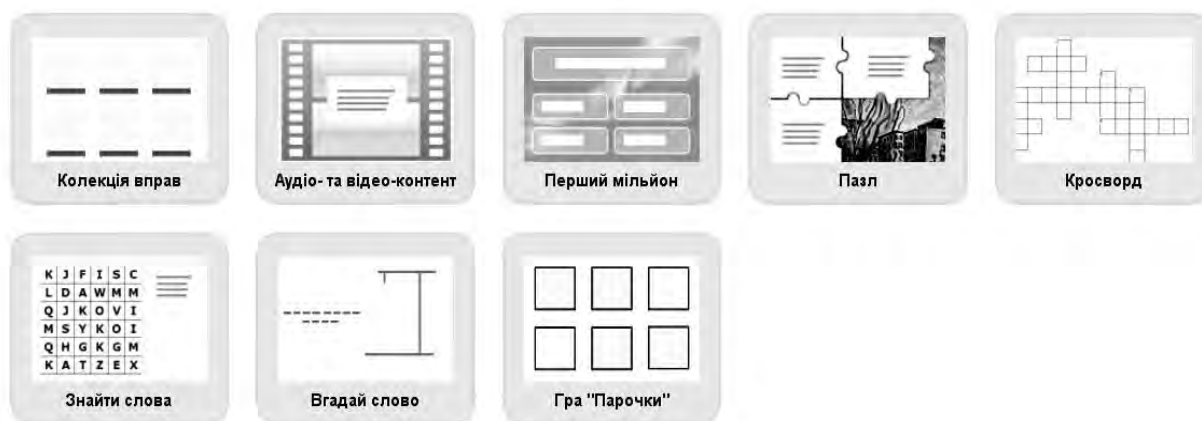
Рис. 1. Додаткові шаблони вправ сервісу LearningApps.org

В умовах дистанційного навчання в закладах освіти LearningApps.org став таким популярним, що розробникам довелося відключити деякі функції. Розглянемо як можна використовувати різні типи вправ (рис. 1) на різних етапах уроку.