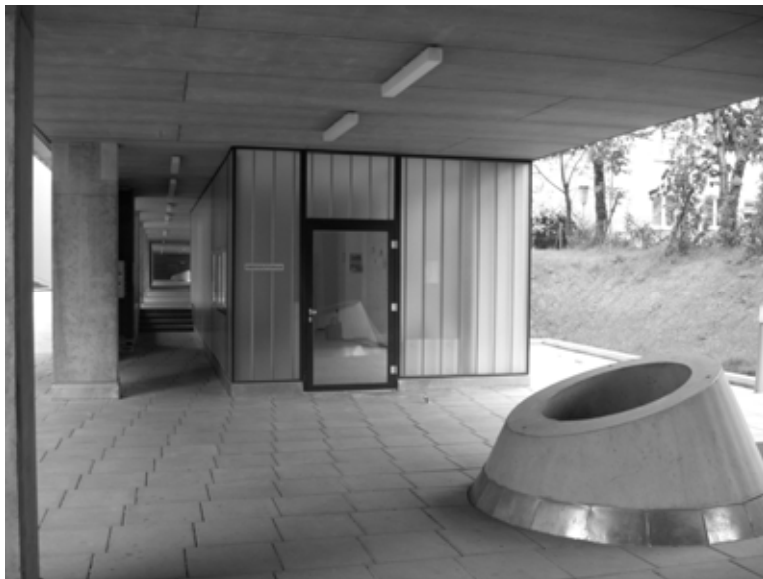
Рис. 4. Приклад кімнати тимчасового перебування для дітей в житловому середовищі (вбудованого типу) (Берлін)

проектування приміщень короткочасного перебування можна чіткіше обґрунтувати їх розрахунок в житловому середовищі та виявити доцільність та ефективність функціонування.