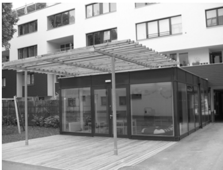
Рис. 3. Приклад кімнати тимчасового перебування для дітей в житловому середовищі (прибудова) (Відень)

Треба зазначити, що приміщення короткочасного перебування в житловому середовищі поширені за кордоном – в Австрії, Німеччині, Польщі та ін. [3] (рис. 3, 4). Такі утворення в структурі житлових будинків зустрічаються доволі часто. Вони складаються з одного приміщення, призначеного для дітей. Середня площа такого приміщення становить близько 40,0 м 2 .