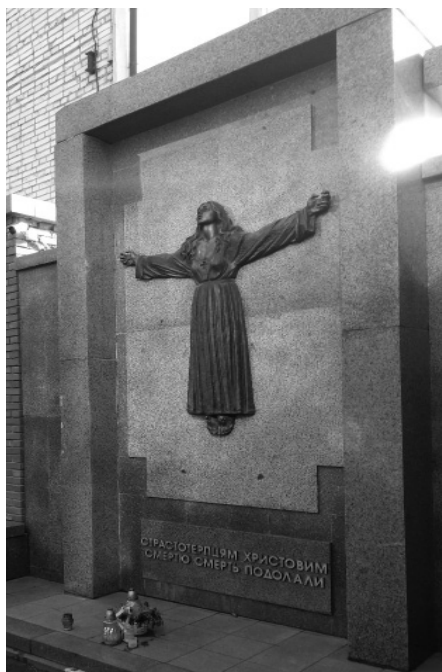
Меморіал жертвам репресій московського комуністичного режиму в Україні, Янівський цвинтар.