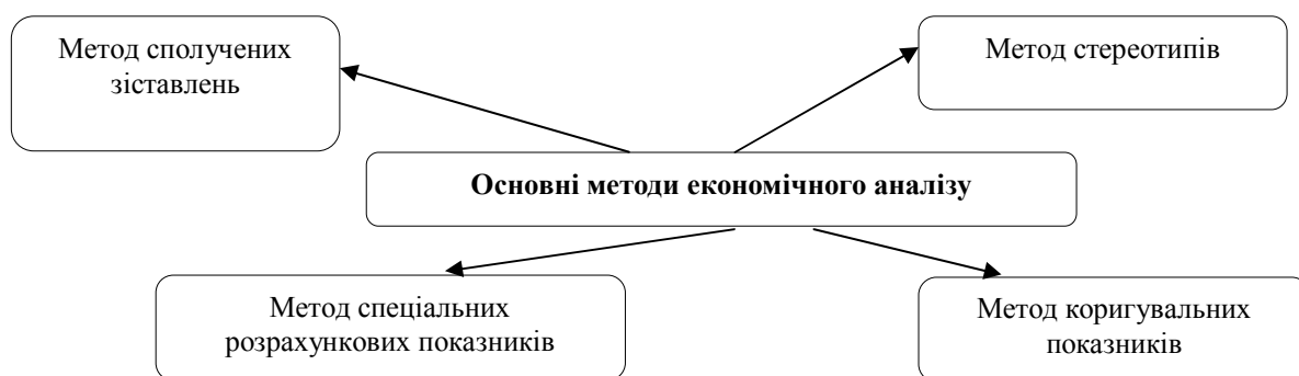
Рис. 2. Основні методи економічного аналізу для виявлення фінансових правопорушень

Одним із спеціальних засобів і прийомів для виявлення економічних і фінансових правопорушень являються методи економічного аналізу (рис. 2).