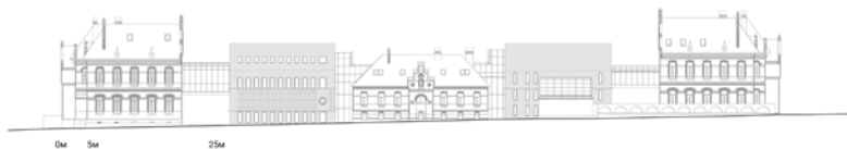
Facade from Smal-Stotskoho st.

Historic buildings are complicated tasks for all investors. An object can be an example of preserving the historical heritage not only in visual details and a silhouette but also its preserving the place spirit. Project Year: unrealized, project 2018. Project Location: Lviv. Project area: before reconstruction 4,716.39 sq.m, after reconstruction -5,975 sq.m.