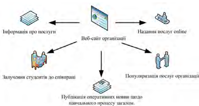
Рис.1. Основні функції веб-сайт органу студентського самоврядування

Загалом процес популяризації послуг ООС у закладах вищої освіти доцільно розділити на 7 основних етапів: обробка розпоряджень; класифікація запитів; класифікація послуг; оформлення звітів; структуризація інформації; опрацювання online запитів; систематизація студентських потреб (Рис. 2).