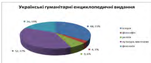
Рис.3. За галузями знань (1992-2019 рр.) (за “Корпус енциклопедичних видань України: онлайн-покажчик” +)[3]

Характеризуючи зазначені видання за основними галузями знань, слід зауважити, що найбільшу увагу приділено культурі та мистецтву, на другому місці – історія.