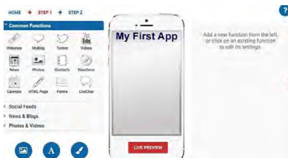
Рис.3. Конструктор додатків AppMakr

В результаті аналізу та порівняння обрано мобільний додаток Мо-apps, адже він найбільше підходить за параметрами та особливостями, завданням роботи.