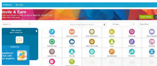
Рис.2. Конструктор додатків Appy-Pie

Наступною програмою для розгляду стала Appy-Pie (Рис.2). Розробка програми розпочинається з вибору категорії проекту, наприклад, фотографії, продажі або освіта. Далі вже можна вбудувати додаткові функції зі списку, інтегрувати соціальні мережі, блоги. Одразу можна налаштувати дизайн, шрифти, меню і одразу тестувати результат на телефоні праворуч. Appy-Pie пропонує безкоштовний період з рекламою протягом 48 годин; базову підписку за 15$ за місяць (застосунок для Android), та платину підписку 50$ за місяць з можливістю створення мобільного застосунка на платформах Android, IOS та Amazon.