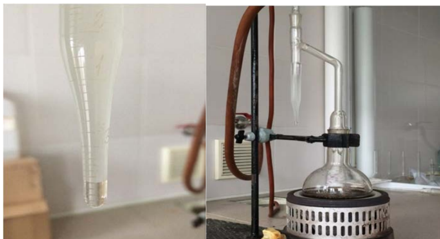
Рис. 3. Визначення вмісту води в оливі методом Діна і Старка

де V_0 – об'єм води в пастці, см 3 ; m – маса проби оливи, г.