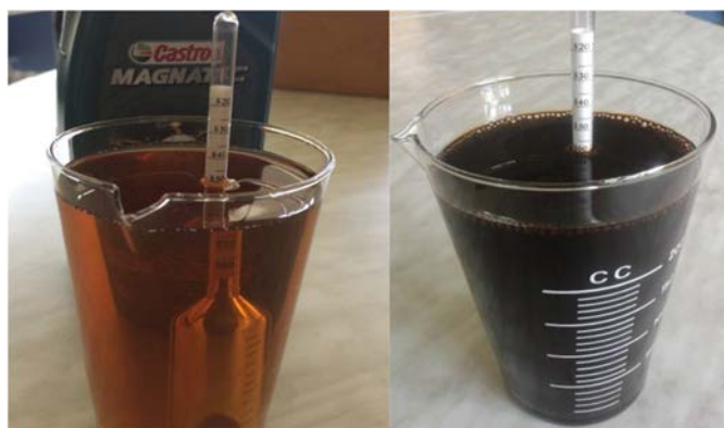
Рис. 2. Визначення густини оливи

Вміст води в оливах не допускається. Розчинена вода в оливі підвищує її корозійність, погіршує змащувальні властивості, призводить до вимивання присадок.