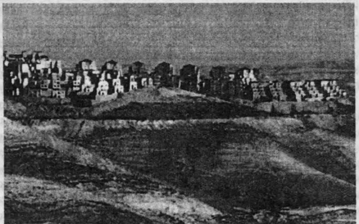
Рис. 3. Поселення Ма'але Адумін (Ma'ale Adumin), розташоване 15 км на схід від Єрусалиму