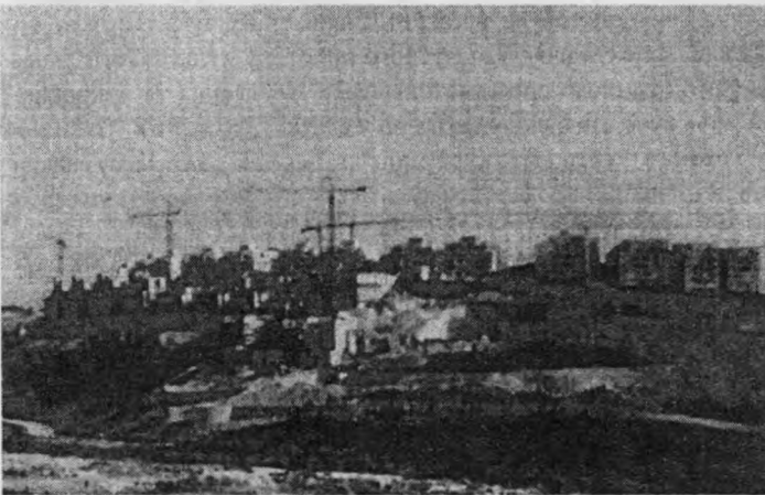
Рис. 2. Будівництво поселення Гар Гома (Нат Нота) біля Вифлеєму. 2001 р.