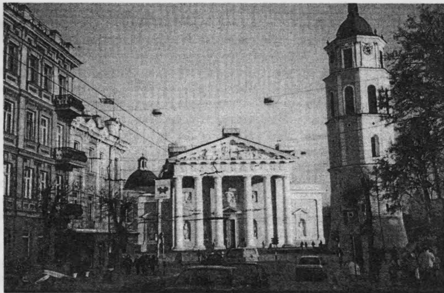
Рис. 1. Архікатедра у Вільнюсі. Фото М.Пурвінаса, 1996 р.

Ліквідація церкви, як акт боротьби з релігією, була важливою ланкою радянської ідеології, адже церкви – потенційні символи незалежності. Архікатедра у Вільнюсі символізувала історичний момент, який був непотрібний радянському режиму. Це був також символ незалежності держави – древнього Великого князівства Литовського.