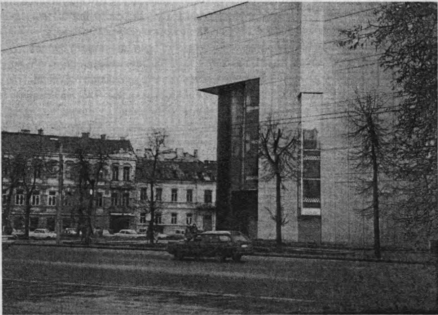
Рис. 5. Центральний будинок Комуністичної партії у Старому місті у Вільнюсі. Фото М.Пурвінаса, 1996 р.

Символ радянської ідеології і честолюбства в архітектурі: агресивна споруда політичної будівлі у Старому місті Вільнюса, що є характерним прикладом діяльності архітекторів середини 1980-х років. Архітектори отримали дозвіл на знесення кварталу у Старому місті для спорудження там Центрального будинку Комуністичної партії й політичних організацій. У цьому комплексі Герострата втілилися принципи примітивного модернізму, особистих амбіцій (бажання увічнити себе, прагнення привілеїв і прихильності влади), які поєдналися зі стратегічними цілями радянського режиму та ліквідацією ідеологічно ворожої історії та культурної спадщини Литви.