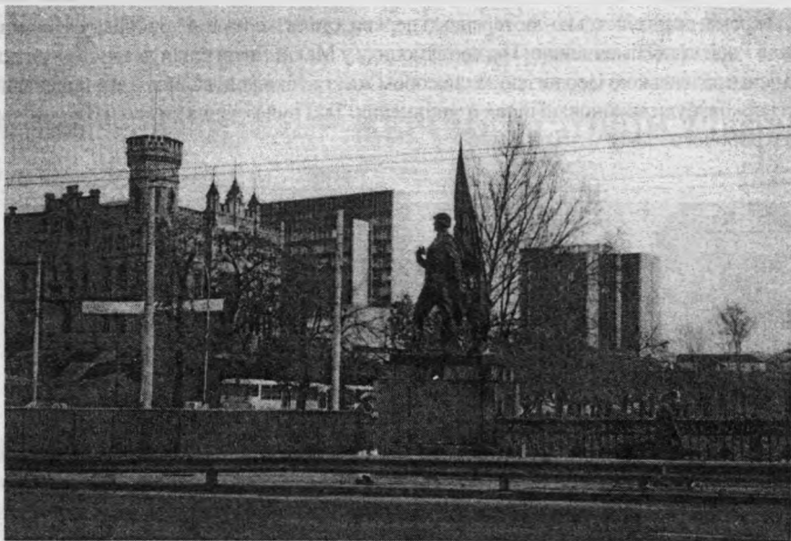
Рис. 3. Пам'ятник Радянській Армії і московський "хмарочос" у центрі Вільнюса. Фото М.Пурвінаса, 1996 р.