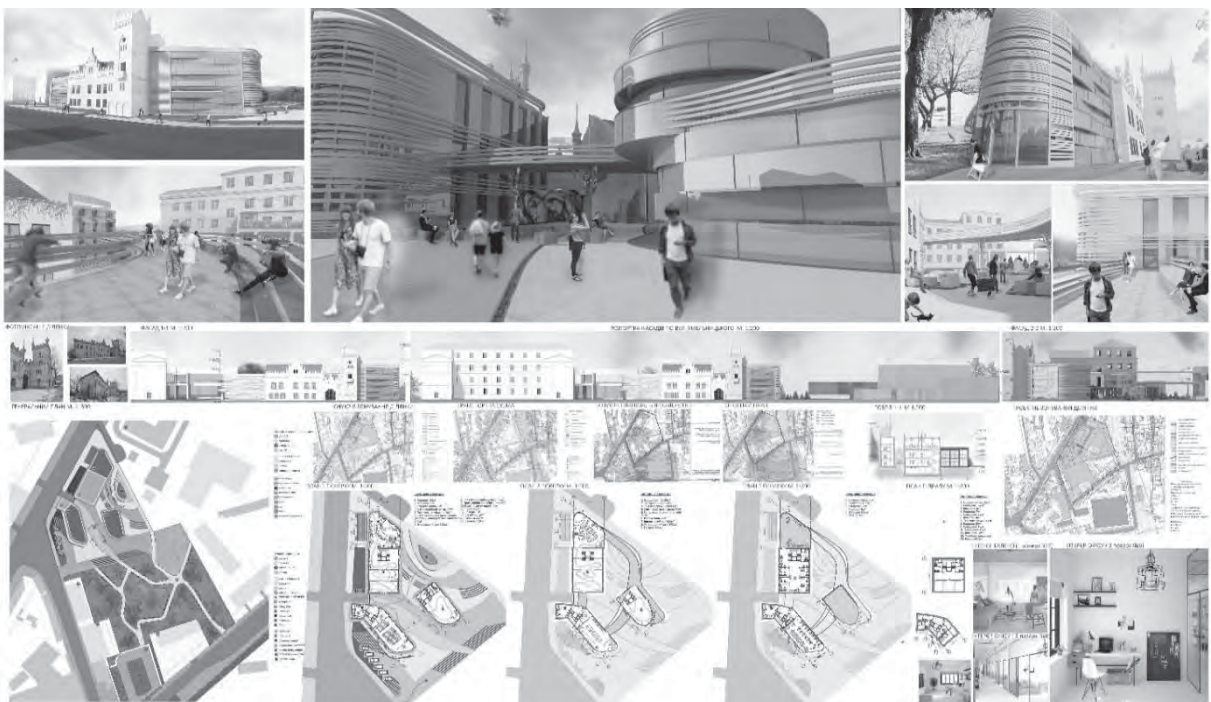
Рис. 2. Дизайн архітектури центру творчості та дозвілля для дітей на базі школи закритого типу ім. Андрея Шептицького (у районі Знесіння у м. Львові)