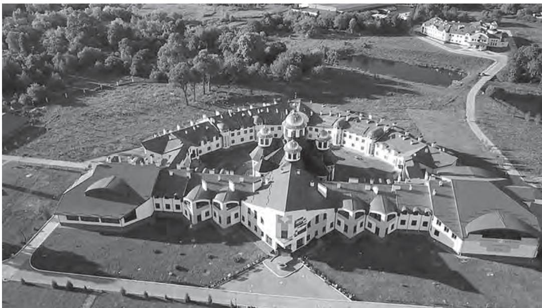
Рис. 2. Комплекс Львівської духовної семінарії УГКЦ (м. Львів, вул. Хуторівка)