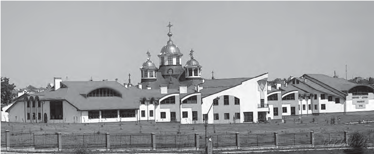
Рис. 3. Головний фасад Центру вищої богословської освіти і формації УГКЦ у м. Львові на вул. Хуторівка