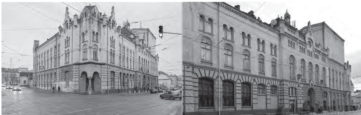
Рис. 1. Львівський драматичний театр імені Лесі Українки

Західні регіони України, як і вся наша держава, у різні часи перебували під владою різних народів, а відповідно під впливом різних культур. З цих причин культурно-мистецький розвиток відбувався на перетині різних культур, вбирав яскраві барви запозичень, створював власну синергію. Для прикладу, серед львівських театральних споруд цікавим прикладом багатогранності та практичності є приміщення Львівського драматичного театру імені Лесі Українки (рис. 1).