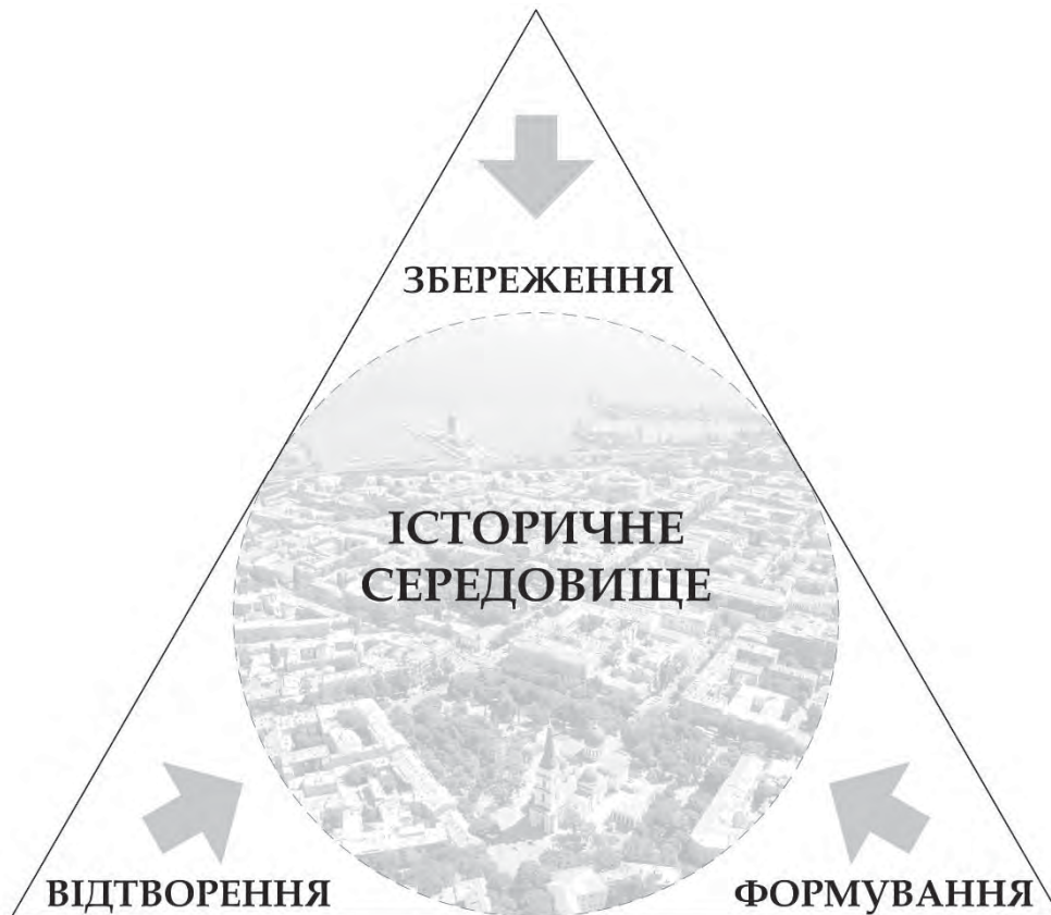
Рис. 7. Парадигма варіантів ставлення до історичного середовища