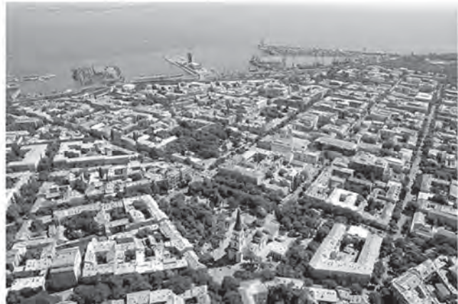
Рис. 2. Історичний центр Одеси на початку XXI ст.

Відповідно до виконаної у 2007 р. і затвердженої наказом Міністерства культури і туризму України від 20.06.2008 р. № 728/0/16-08 науково-проектної документації “Історико-архітектурний опорний план, проєкт зон охорони, визначення меж історичних ареалів Одеси” (рис. 2) визначено межі Центрального історичного ареалу й ареалу Французький бульвар, введено обмеження на висоту нових об’єктів.