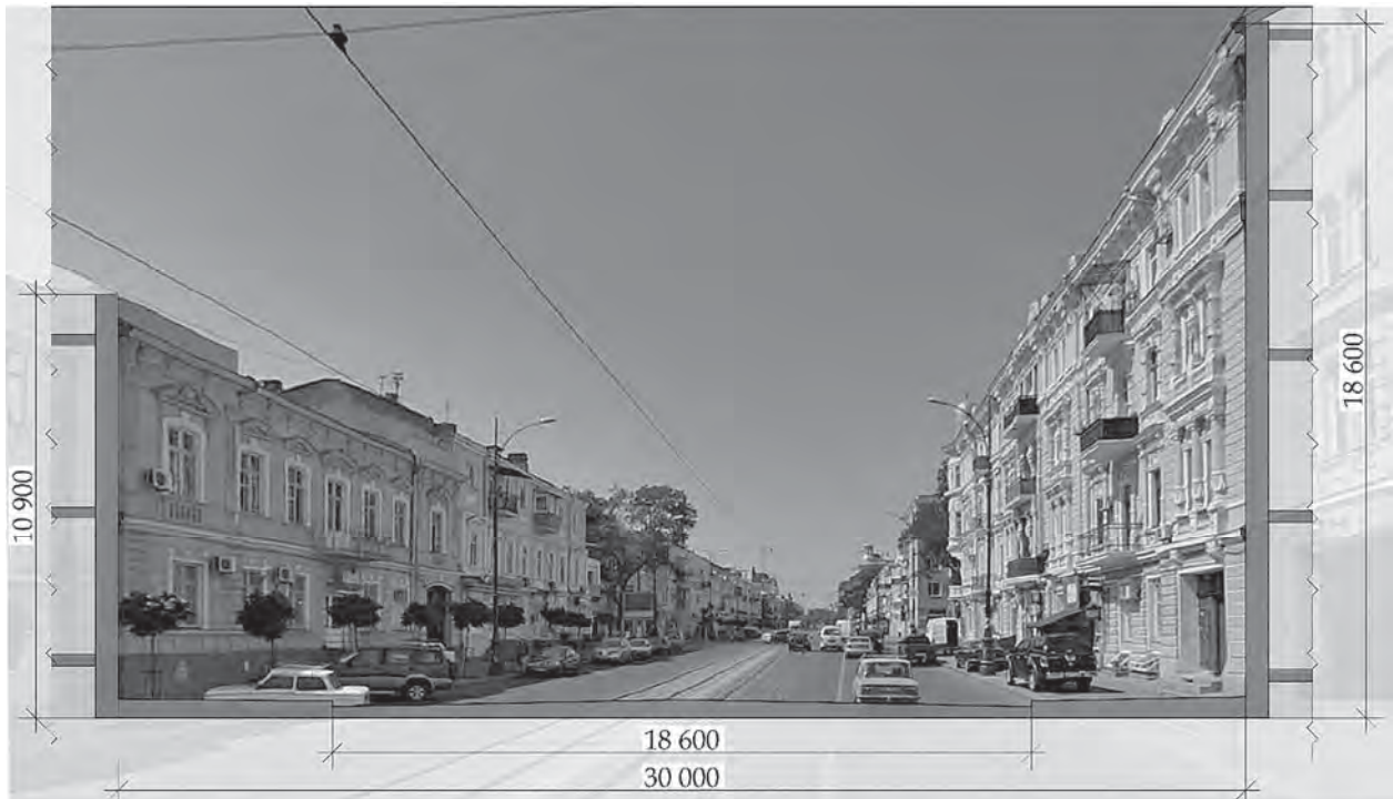
Рис. 4. Масштаб історичної забудови Одеси, вул. Тираспольська, архів В. М. Мецзякова

У Центральному історичному ареалі рядова периметральна забудова повинна бути до 18,6 метрів (рис. 3), на кутах кварталів – до 21,4 метра. Використано коефіцієнт золотого перетину – 0,62.