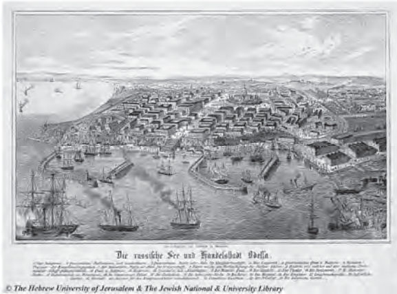
Рис. 1. Образ Одеси на гравюрі середини XIX ст.