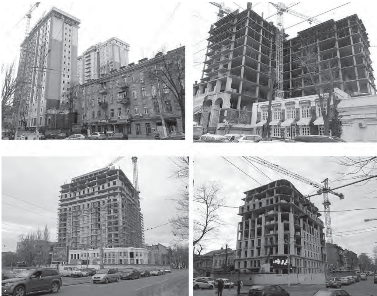
Рис. 5. Будівництво дисонуючих багатопверхівок у Центральному історичному ареалі Одеси