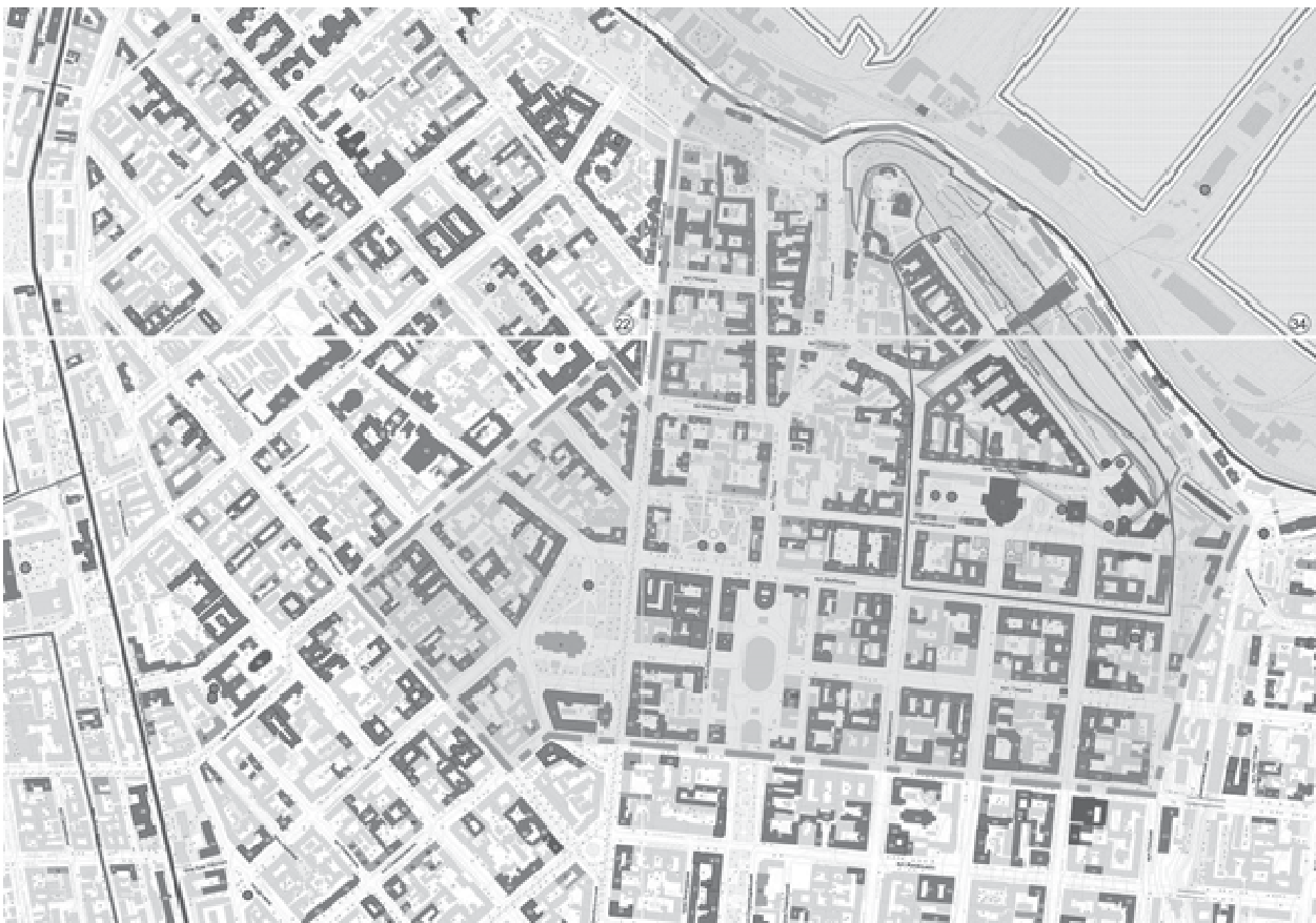
Рис. 3. Викопювання із “Історико-архітектурного опорного плану...” міста Одеси, за документами Одеської міської ради

Відповідно до виконаної у 2007 р. і затвердженої наказом Міністерства культури і туризму України від 20.06.2008 р. № 728/0/16-08 науково-проектної документації “Історико-архітектурний опорний план, проєкт зон охорони, визначення меж історичних ареалів Одеси” (рис. 2) визначено межі Центрального історичного ареалу й ареалу Французький бульвар, введено обмеження на висоту нових об’єктів.