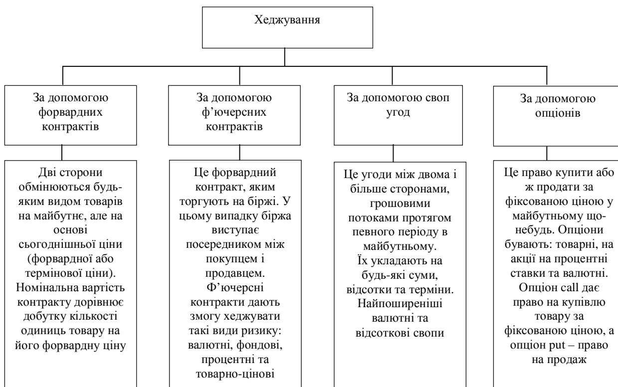
Рис. 2. Методи хеджування ризиків ЗЕД

Одним із важливих та достатньо поширених методів управління ризиками в зовнішньоекономічній діяльності є хеджування. Хеджування (від англ. hedge – захищатися від можливих втрат, ухилитися, обмежувати) спрямоване на створення захисту від можливих фінансових збитків у майбутньому, пов'язаних зі зміною ринкової ціни фінансових інструментів чи товарів. Хеджування активно застосовувалося у банківській, біржовій та комерційній діяльності з метою страхування валютних ризиків. Проте сьогодні хеджування розглядається як страхування ризиків від несприятливих змін цін на будь-які товарно-матеріальні цінності за контрактами або комерційними операціями, що передбачають поставку чи продаж товарів у майбутньому. На рис. 2 наведено найпоширеніші способи хеджування ризиків ЗЕД.