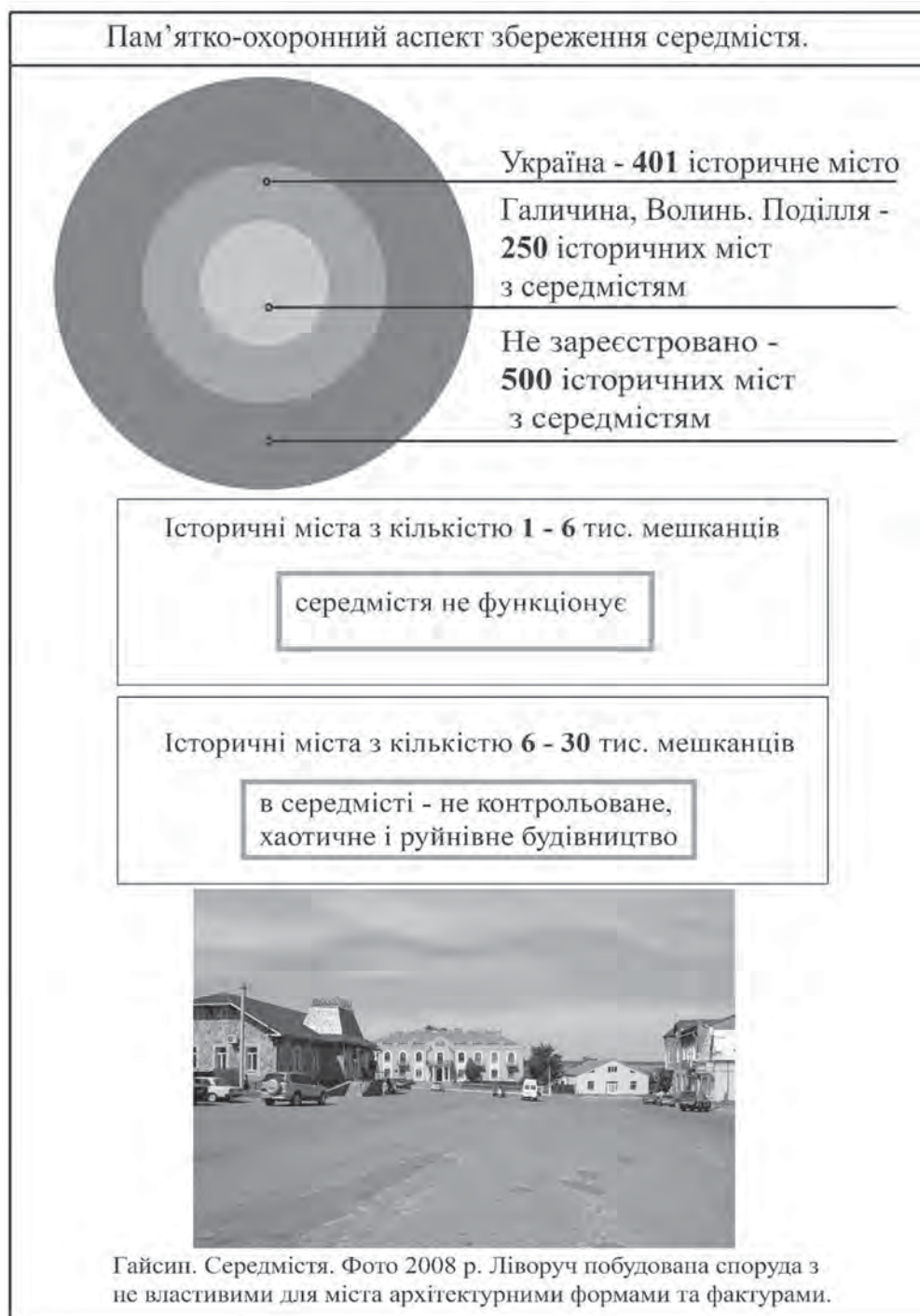
Рис. 3. Пам'ятко-охоронний аспект збереження середмістя

У прикладі середмість історичних міст України, критеріями визнання їх пам'ятками містобудування виступатимуть: стан збереженості планувальної та об'ємно-просторової структури, традиційна забудова пов'язана з періодами розвитку, стилями та етнокультурними чинниками, комплекс оборонних споруд (підземні та наземні релікти), важливі сакральні об'єкти (церкви, костели, каплиці, синагоги), малі архітектурні форми (криниці, придорожні фігури, каплиці), місця пам'яті (території пов'язані з втраченими важливими спорудами середмістя, видатними людьми, які вплинули на розвиток регіону та країни, літературними та образотворчими фіксаціями), характеристики ландшафту та мальовничі панорами вулиць, площ та цілого середмістя. Згідно з попередніми характеристиками, на думку автора, в реєстр пам'яток містобудування варто зарахувати середмістя