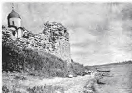
Рис. 8. Рештки Ладозької фортеці. Сучасний вигляд.