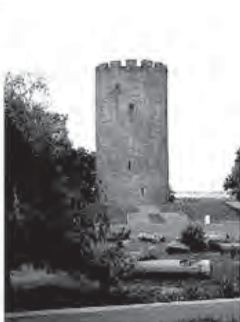
Рис. 2. Вежа в Кам'янці