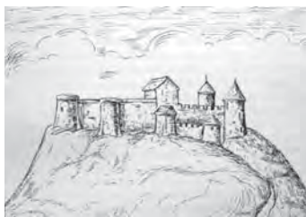
Рис. 11. Високий Замок кінця XVII ст.