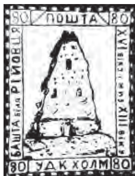
Рис. 5. Вежа у Рійовці