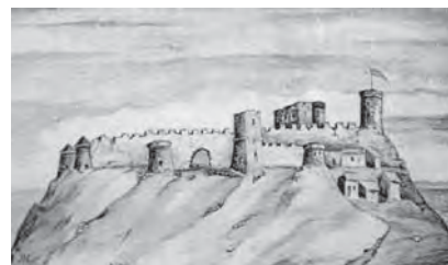
Рис. 12. Високий Замок середини XVIII ст.

Поглиблене вивчення історичних відомостей, археологічних досліджень, ілюстративних і писемних документів дало підстави для нової версії реконструкції Високого Замку у Львові, виокремити кілька етапів його розвитку. Ілюстрації (рис. 10. 11. 12) та описи Замку вказують на низку особливостей, яких не могли логічно витлумачити попередні дослідники. Головна причина в тому, що для них немає аналогів в оборонному будівництві середньовічної Польщі. Натомість, звернення до прийомів оборонної архітектури Передньої Азії (Візантія, Сирія, Палестина), епохи хрестових походів, дозволило переконливо реконструювати ці особливості і віднайти аналоги (Могитич, 2005, с. 99–119).