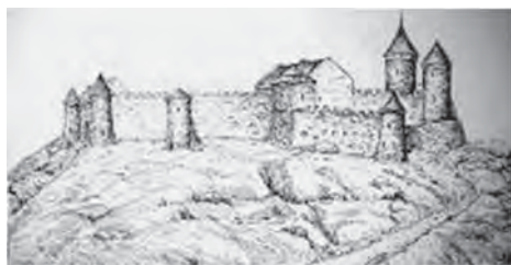
Рис. 10. Високий Замок у XVII ст.

Деякі дослідники Високого Замку спираються на аннали польського історика Я. Длугоша. Длугош зазначає, що Казимир III спалив дерев'яний замок, але аналіз його праць доводить що це не підкріплено історичними фактами. Досліджуючи хроніку Яна Длугоша (який описував похід Казимира III на Львів у 1340 році і спалення замку), професор О. Семкович (Aleksander Semkowicz; 1850–1923) зробив висновок: “Якщо в описі походу Казимира на Львів, Длугош спирався на надійні джерела, то згадка про дерев'яний замок є його власним доповненням. Це доповнення, зроблене більш ніж століття, після описаних подій, має сумнівну достовірність” (Semkowicz, 1887, s. 52–55). Деякі дослідники Високого Замку замовчують ще один важливий фактор: безпосередньо під фундаментами кам'яних стін було знайдено чотири глиняні глечики. За давньоруським звичаєм, щоби стіни стояли міцно, у такі глечики клали будівельну жертву. Це ще раз підтверджує руський пріоритет побудови замку. Незважаючи на ці аргументи, через жертвний вівтар язичників та купи спаленого вугілля, більшість дослідників продовжують представляти замок Лева дерев'яним, а Казимира кам'яним.