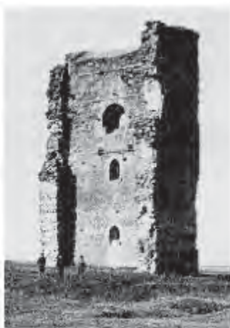
Рис. 1. Вежа в Белавині