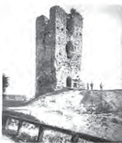
Рис. 3. Вежа в Столп'є