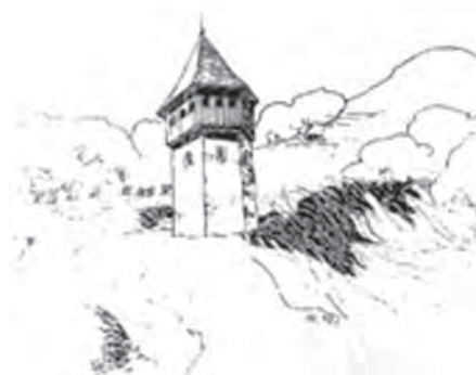
Рис. 6. Вежа XIII ст. у Кривчицях. Реконструкція Р. Сулика