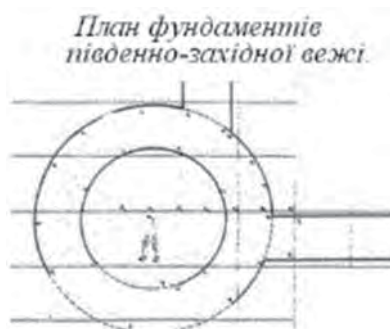
Рис. 4. План південно-західної вежі

Унікальною є також резиденція (рис. 9) Данила Романовича у Холмі, яка належала до кращих європейських дворів. Керівник археологічних розкопок у Холмі професор Анджей Буко, який досліджував замковий палац Данила, розповідає: “Данило Романович свою резиденцію створив на зразок європейських дворів. Стіни палацового двору Данила мають 2 метри завширшки. Складаються зі стін – зовнішньої і внутрішньої. Лицева і внутрішня сторони стіни викладені з блоків різновидів піщанику, так званого глауконіту: зеленого каменю, що трапляється тільки в Холмі. Простір між цими стінами заповнений маленькими кавалками піщаника, скріпленого розчином. Таке будівництво свідчить про те, що ми маємо тут справу зі східними впливами, руськими, і навіть візантійськими. Аналогічні об’єкти і спосіб складання не знайомі на території Польщі, але їх можна знайти в зоні впливу візантійської (Kowalski, 2009).