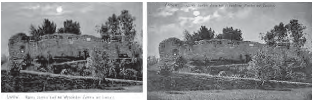
Рис. 13. Поштівки із зображенням руїн стіни Високого Замку у Львові

У країнах Прибалтики відновлення моментів історичної пам'яті вважається важливим внеском в утвердження власної державності. Більшість міжнародних засад і Хартій ICCROM заперечують реконструкцію (відтворення) культурної спадщини. Для вирішення цього питання була ініційована регіональна конференція ICCROM “Культурна спадщина: автентичність і історична реконструкція”. Конференція відбулася 23–24 жовтня 2000 р. у столиці Латвії Ризі. Делегати ICCROM спільно з делегатами від Канади, США й Великобританії, Естонії, Латвії, Литви, Білорусі та України прийняли Ризьку хартію про автентичність та історичну реконструкцію культурної спадщини (2000, пункт 6): “З огляду на те, що у країнах, які нещодавно відновили свою незалежність, питання реконструкції та автентичності набули особливої ваги і значна кількість таких заходів планується і втілюється в життя, делегати дійшли згоди: “що у виняткових випадках реконструкція культурної спадщини, втраченої в результаті стихійних чи спровокованих людьми лих, може бути прийнятною, коли для історії та культури відповідного регіону конкретна пам'ятка має символічне значення”.