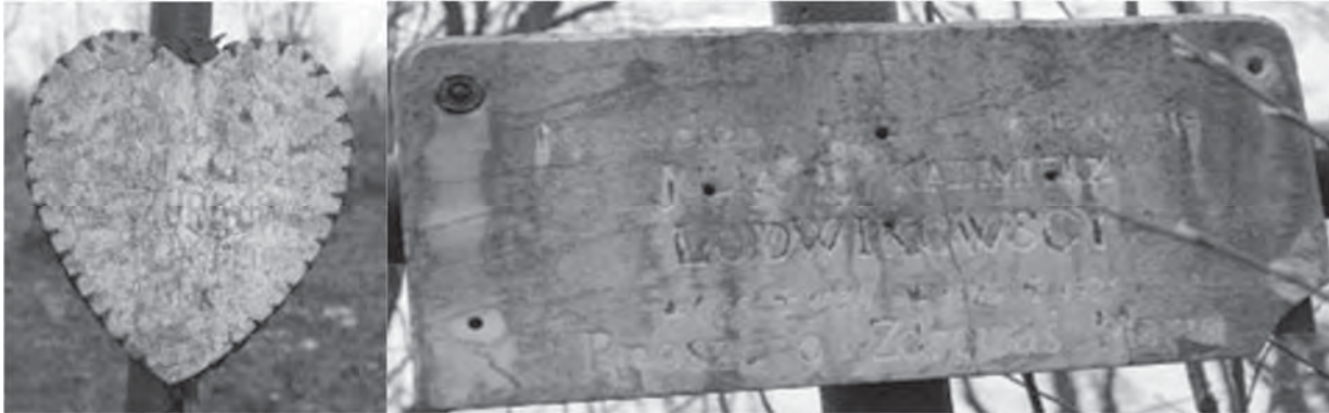
Рис. 4. Пам'ятні дошки з мармуру

Лише на кладовищі на Гуковій горі ми мали можливість спостерігати мармур, при чому і як елемент надгробних пам'ятників, і як пам'ятні дошки, вставлені у металеві оправы та прикріплені до хрестів (рис. 4). Оскільки мармур зазнав значного руйнівного впливу біологічних, температурних та атмосферних чинників, виникає певна проблема з його ідентифікацією.