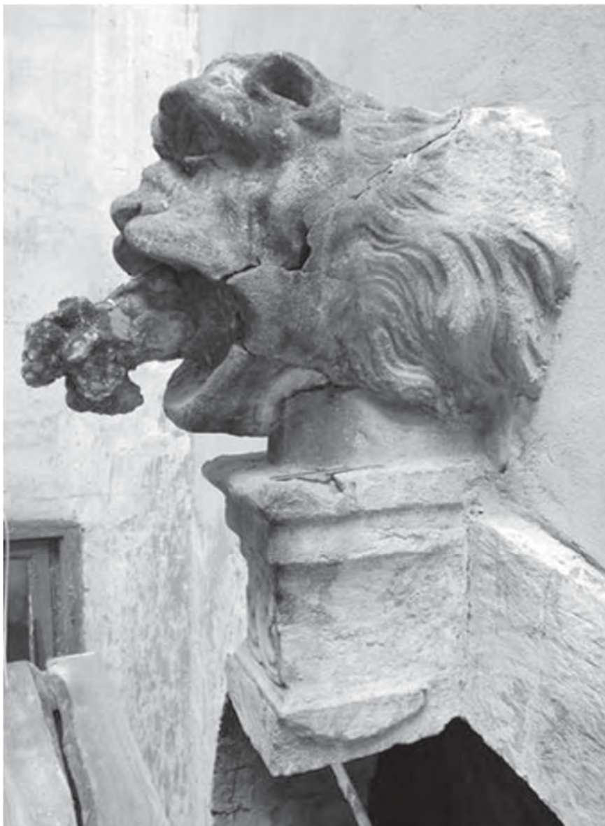
Рис. 1. Пам'ятка перед реставрацією (травень 2011 р.)

У розробленій програмі реставраційних заходів було передбачено: 1) виконання відбортуння довкола голови, консолі та кам'яної кладки арки з метою обмежити доторкання цементу до пам'ятки; 2) очищення голови від колоній мохів та лишайників; 3) очищення каменю від портландцементних перетирок та шпаклювань; 4) демонтаж винограда та скородованої та потрісканої цегляно-цементної опори під щелепою; 5) розчищення та склеєння частин щелепи та гриви; 6) очищення від портландцементу і виїняття зіржавілого металевого дроту з винограда та склеєння його фрагментів; 7) очищення автентичного залізного анкера винограда від корозії та його полімерне лакування; 8) монтаж тонкої білокам'яної стінки (товщина 5 см.) в левовій пащі та кріплення до неї винограда; 9) монтаж вапнякового кам'яного блоку-опори головою і консоллю; 10) допастивання втрачених частин та сколів кам'яної кладки арки; 11) ін'єктування тріщин та приклеєння відбитих частин каменю; 12) увиразнення важливих для сприйняття частин кам'яної кладки арки; 13) реставраційне акцентування профільованих блоків та сліду від конструкції накриття прямоку сходов у півницю; 14) виконання відсолюючого компресу на голові лева; 15) структурне зміцнення каменю вапняку кремнійорганічним зміцнювачем; 16) лісірування допастованих фрагментів; 17) консервація металевого кільця; 18) покриття голови лева, консолі та нижніх частин арки біоцидним розчином.