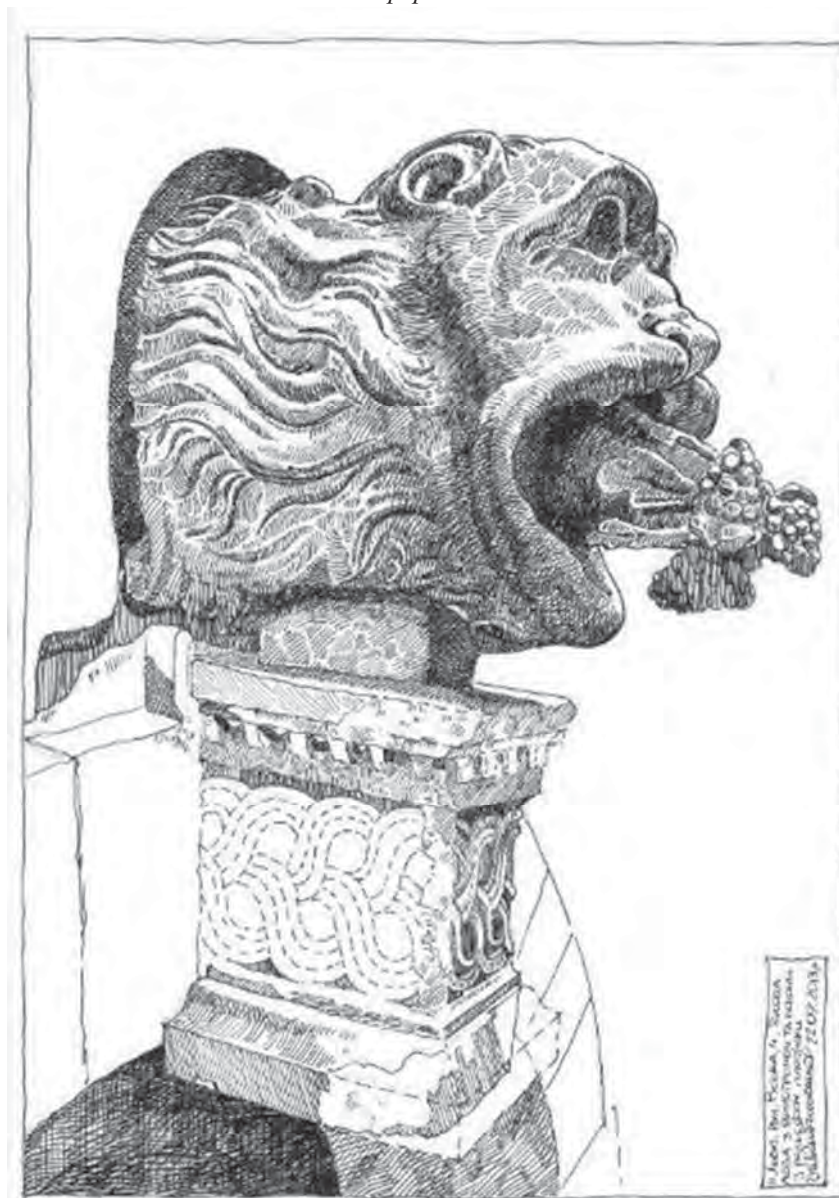
Рис. 4. Голова лева і консоль після реставрації