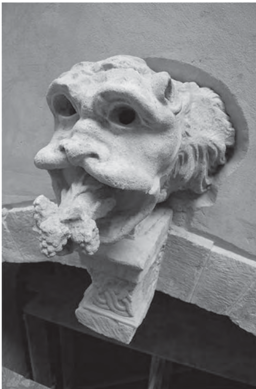
Рис. 2. Пам'ятка після реставрації (вересень 2011 р.)

Під час проведення робіт відкрилося, що внутрішня частина кам'яних блоків арки має чорну “дику” патину, яка свідчила про їхнє повторне використання. Голова лева виявилася у середині порожня, квадратна в перерізі, з товщиною стінок від 4 до 8 см. У внутрішній частині щік збереглися поздовжні акуратно вирізьблені пази (рис. 3). На внутрішніх стінках збереглися сліди від різьбярських зубил. Очі лева з наскрізними отворами, які починалися від внутрішньої великої порожнини. Довжина збереженої голови сягала одного метра. Під час обстеження вмурованої у стіну частини виявили, що вона навскіс обрубана під час демонтажу з первісного місця розташування. Консоль перед монтажем у місце замку арки підтесували і знищили лівобічну частину плетінки, на чільній стороні відрізали базу з профілем та зубчатий фриз (рис. 4). Правий бік консолі дуже пошкоджений, тому неможливо стверджувати про її оздоблення у минулому.