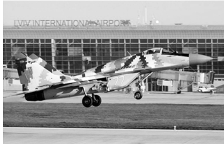
Рис.2 Проект військової модернізації МіГ-29 до версії МУ2. Львівський авіаційний завод

Наступною галуззю, що може стати об'єктом цілеспрямованої фаворитизації є видавнича справа, перспективи якої пов'язані із комбінацією близькості ключових целюлозних ресурсів (Жидачівський ЦПК) з інерційним сприйняттям Львова як інтелектуального та культурно-мистецького центру. Перспективним напрямком фаворитизації, котрий, потенційно здатен пережити переваги слаборозвиненої економіки це галузь військового виробництва, котра з одного боку володіє професійною тяглістю (Львівський авіаремонтний завод, Львівський бронетанковий завод), а також і тими факторами котрі мають сучасну генезу - увагу України до оборонної промисловості після 2014 року.