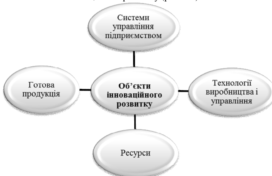
Рис. 1.1. Об’єкти інноваційного розвитку

Як свідчить досвід зарубіжних країн з ринковою економікою господарювання суб’єкти кооперування розвивають інноваційну діяльність на засадах системно-процесійного підходу. Тобто, у результаті взаємодії суб’єктів кооперування формується певна система інноваційного розвитку, яка охоплює усі стадії інноваційного процесу – від висунення інноваційної ідеї до удосконалення і модифікації інноваційної продукції під час комерціалізації інновацій. У результаті взаємодії суб’єктів кооперування формується певна системи інноваційного розвитку, яка є однією з підсистем управління, функцією якої є формування інноваційного потенціалу і його практичне застосування на засадах активізування креативних пошуків працівників, впровадження сучасних технологій, розробки нетрадиційних шляхів розв’язання виробничо-господарських проблем, покращання властивостей існуючої і створення нової продукції. Складовими елементами системи інноваційного розвитку, як і будь-якої іншої системи управління, є: цілі, суб’єкти і об’єкти, технології і методи, управлінські рішення, інформація та комунікації. Взаємодіючи, складові елементи системи інноваційного розвитку репрезентують собою процес інноваційного розвитку. Розкриття його сутності необхідно здійснити через призму складових елементів системи інноваційного розвитку. Так, елементом цієї системи, який чітко відрізняє її від інших систем є об’єкти інноваційного розвитку (рис. 1.1).