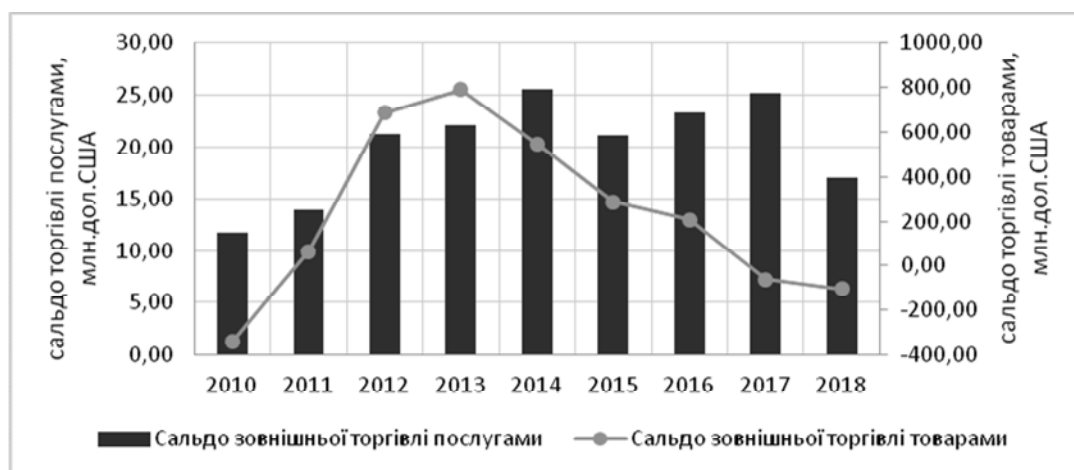
Рис. 2. Динаміка сальдо торгового балансу товарів та послуг у 2010-2018 роках Складено автором за даними [1]

Починаючи з 2013 року сальдо торгового балансу почало зменшуватися, а у 2017 та 2018 роках є негативним, що є несприятливим для економіки України. Варто зазначити, що у торгівлі товарами імпорту перевищує експорт та більшою мірою спричиняє від’ємне торговельне сальдо (-104,64 млн. дол. США у 2018 році), торгівля послугами – навпаки, має додатний аналогічний показник (11,43 млн. дол. США).