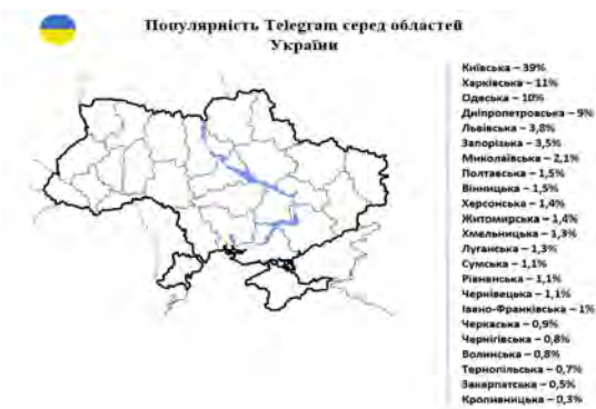
Рис. 1. Поширення Telegram у різних областях України

Основною частиною користувачів цієї мережі, як вказано на рисунку 2, є люди, віком від 18 до 24 років, саме тому найпопулярнішими сегментами мережі є канали про ІТ, гумор, наукові досягнення та сектор новин [4].