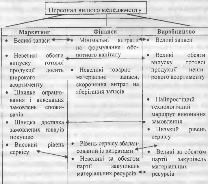
Рис. 1. Можливі конфліктні ситуації в структурі управління підприємством без виділеної функції логістики: \longleftrightarrow - конфлікти інтересів

У традиційних організаційних сферах менеджменту на вітчизняних підприємствах (фінанси, виробництво і маркетинг) спостерігаються конфлікти, що стосуються управління матеріальними і фінансовими та інформаційними потоками (рис. 1).