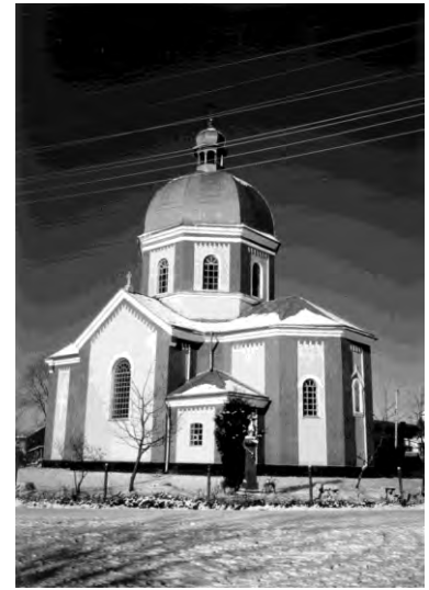
Рис. 11. Церква Миколи в селі Жуличі (1900)