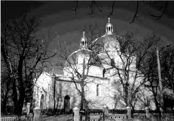
Рис. 5. Церква Воздвиження Ч. Хр. в селі Ожидів (1828)

Серед вищезгаданих церков туристи матимуть можливість відвідати церкву Воздвиження Чесного Хреста в Ожидові, збудовану у 1828 р., церкву Св. Іллі, датовану 1906 р. в с. Княже Золочівського деканату (рис. 4), та церкву Св. Кузьми і Дем'яна з 1886 р. в Червоному Золочівського деканату (рис. 3).