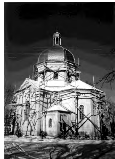
Рис. 16. Церква Введення в Хр. Пр. Б. в селі Ушніа (1904)