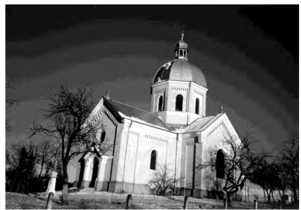
Рис. 13. Церква Іллі в селі Чышки (1902)