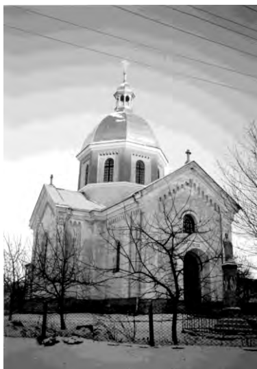
Рис. 14. Церква Введення в Хр. Пр. Б. в селі Хватів (1904)