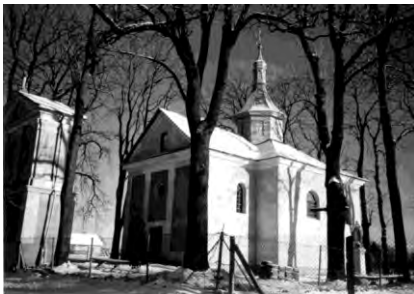
Рис. 19. Церква Воздвиження Ч. Хр. в селі Городилів (1867)