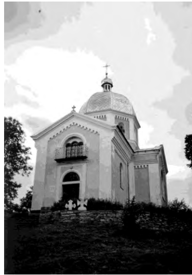
Рис. 18. Церква Вознесіння Г. в селі Побіч (1896)