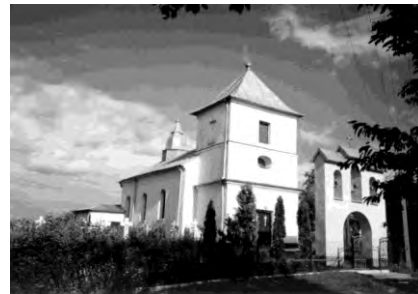
Рис. 20. Церква Параскеви в селі Залісс (1904)

Також доцільно було б ввести у програму туристичних маршрутів хрещаті однобанні церкви: Преображення Господнього в с. Сасів (1898) (рис. 7), архітектор Василь Нагірний; Св. Трійці в Білому Камені (1900), архітектор Василь Нагірний (рис. 8); Св. Параскеви в с. Бужок (1899) (рис. 9); Св. Михайла в с. Розваж (1902) (рис. 10); Св. Миколи в с. Жуличі (1900) (рис. 14); Різдва Пресвятої Богородиці в с. Почапи (1886) (рис. 12); Св. Іллі в с. Чишки (1902) (рис. 13); Введення в Храм Пресвятої Богородиці в с. Хватів (1904) (рис. 14); Преображення Господнього в с. Ясенівці (1897) (рис. 15); Введення в Храм Пресвятої Богородиці в с. Ушня (1904) (рис. 16); Покрови Пресвятої Богородиці в с. Хильчиці (1889) (рис. 17); Вознесіння Господнього в с. Побіч (1896) (рис. 18).