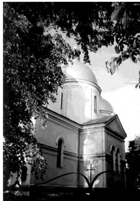
Рис. 4. Церква Іллі в селі Княже (1906) (архітектор Василь Нагірний)