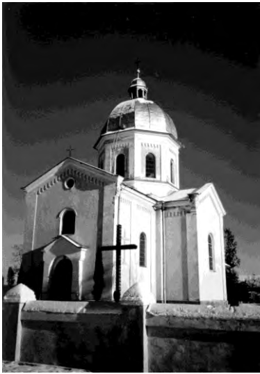
Рис. 9. Церква Параскеви в селі Бужок (1899)