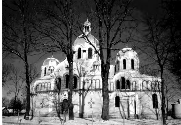
Рис. 6. Церква Миколи в селі Гончарівка (1911) (архітектор Михайло Ковальчук)