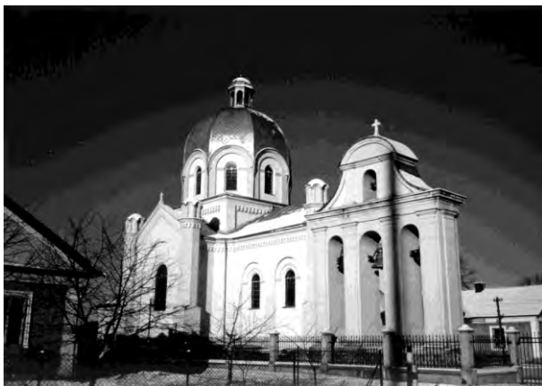
Рис. 7. Церква Преображення Господнього. в селі Сасів (1898) (архітектор Василь Нагірний)