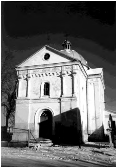
Рис. 17. Церква Покрови Пр. Б. в селі Хильчиці (1889)