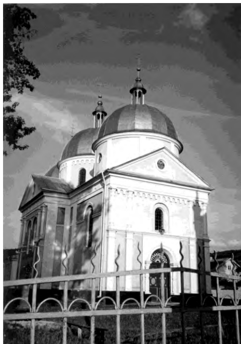
Рис. 3. Церква Кузьми і Дем'яна в селі Червоне (1886) (архітектор Василь Нагірний)