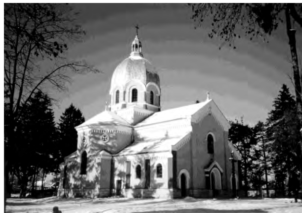
Рис. 8. Церква Св. Трійці в селі Білий Камінь (1900) (архітектор Василь Нагірний)

Надзвичайно цікавим об'єктом є ансамбль Успенської церкви в Олеську, побудований у 1891 р. за проектом Василя Нагірного. Хрещата п'ятибанна церква дуже вдало поєднує візантійські та класицистичні традиції (рис. 2).