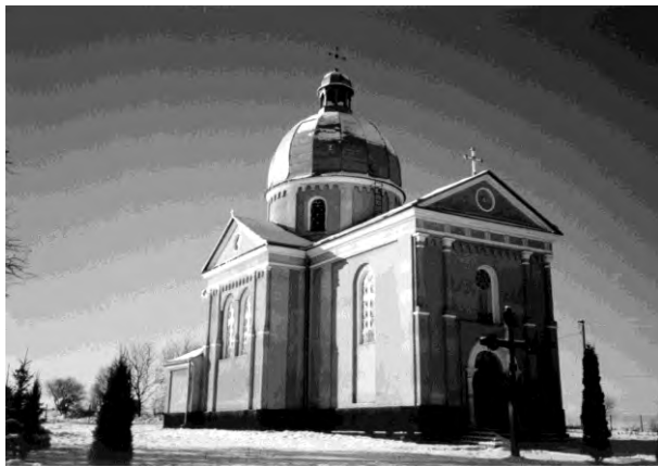
Рис. 12. Церква Різдва Пр. Б. в селі Почати (1886)