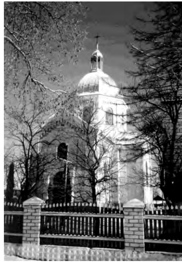
Рис. 10. Церква Михайла в селі Розваж(1902)