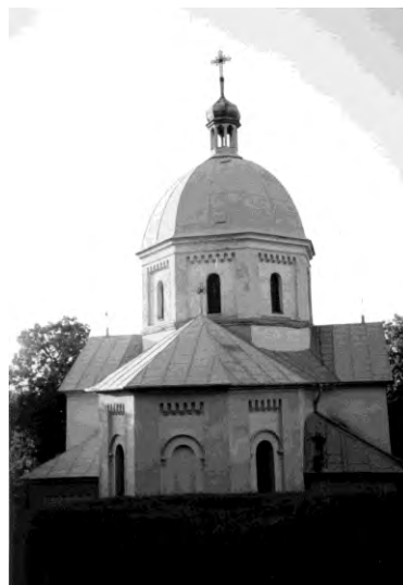
Рис. 15. Церква Преображення Г. в селі Ясенівці (1897)