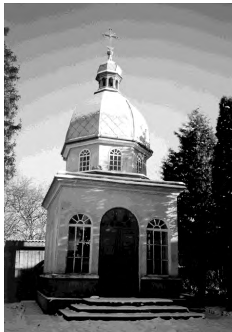
Рис. 2. Ансамбль Успенської церкви в Олеську (1891) (архітектор Василь Нагірний)