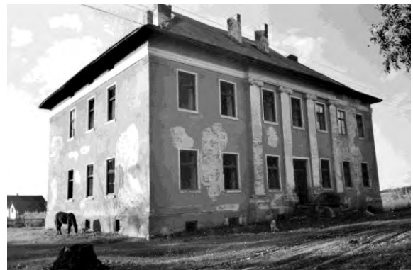
Рис. 2. Збереження будівлі садиби у с. Конюшків

Перший напрямок: у випадку локалізації садиб поблизу міст вони: розширюють культурний потенціал міста як можливі об'єкти екскурсії; можуть бути репрезентативними об'єктами (консульства, готелі, представництва фірм), скажімо, як у Кракові (Польщі) вілла Деціуша. У нас для такої представницької функції можуть бути відтвореними комплекси у селах Виннички, Гряда, Семенівка, Борщовичі, Оброшине, що знаходяться в радіусі 15 км від Львова.