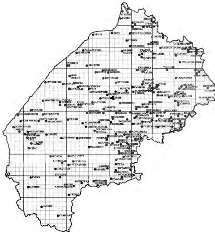
Рис. 3. Мережа міст Львівської області з позначенням історичних міських поселень, які втратили свій статус

Процес містотворення індустріального періоду, який формується на основі попереднього періоду, набуває значних регіональних відмінностей. Початок цього періоду, який збігається із входженням регіону до австрійської імперії, фіксує згадувана вже мапа Ф. фон Міга. Праця над нею припала на час впровадження кардинальних реформ у всіх сферах життя Галичини. Реформуванню