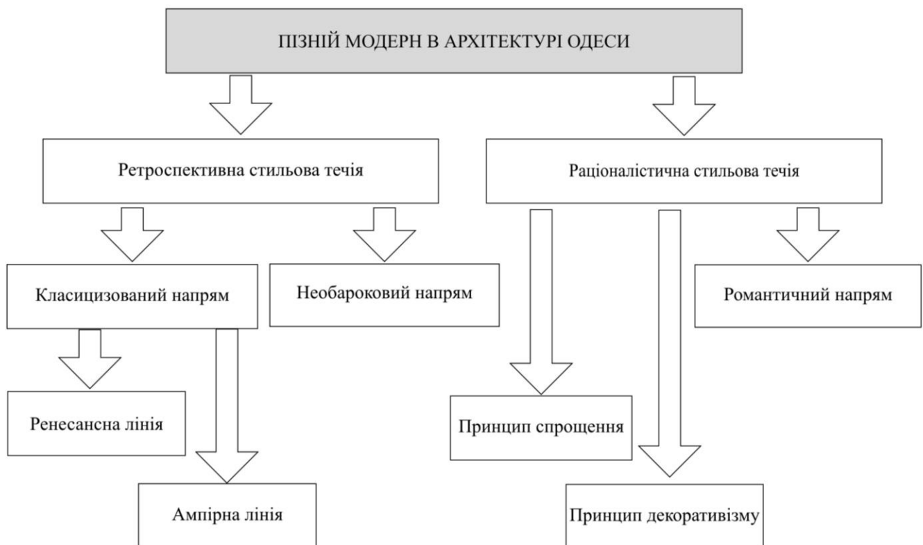
Рис.2 Стиліві течії, напрями і лінії пізнього модерна Одеси.

Ключевые слова: архитектура, стиль, поздний модерн, доходные дома, архитектурная композиция, планировка здания, объемно-пространственная композиция, пластика, 1906-1914 г.