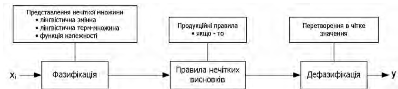
Рис. 1. Модель нечіткої логіки в системі оцінювання

Ці етапи схематично зображено на рис. 1.