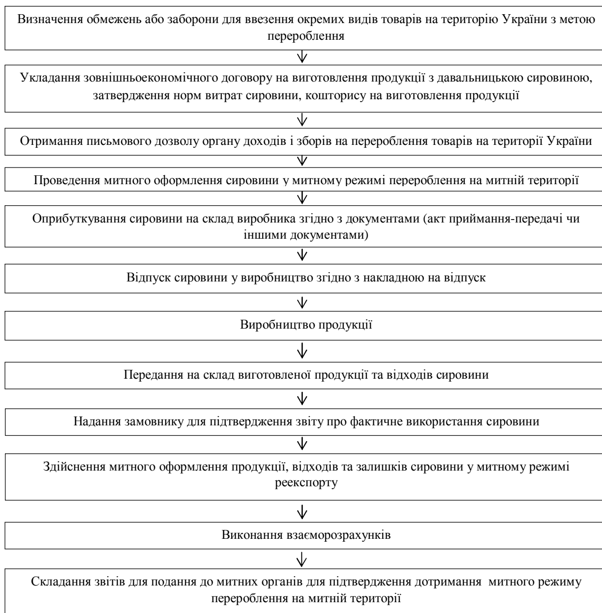
Рис. 1. Алгоритм імплементації толінгових операцій

Як і будь-яка діяльність, толінгові операції є процесом, що складається з певних етапів. Алгоритм імплементації толінгових операцій зображено на рис. 1 [13].