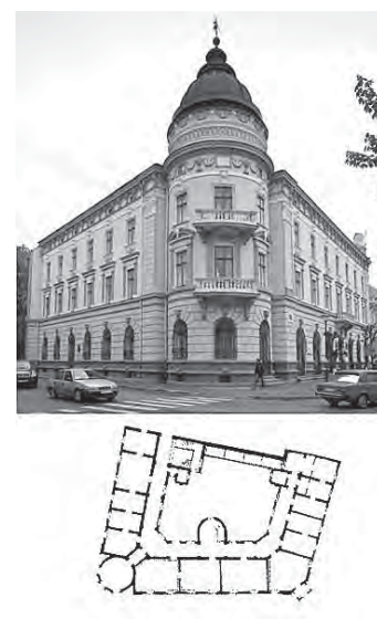
Рис. 3. Народний дім у Коломиї. Загальний вигляд. План першого поверху [17, 18]