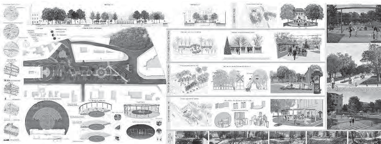
Рис. 4. Проект багатофункціонального середовища в просторі площі Д. Галицького у м. Львові. вик. ст. АРМ-24 М. І. Нагорна [14]