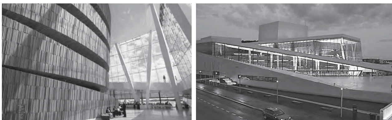
Рис. 1. Головний фасад театру на Подолі в Києві (а); театральна зали театру в Гданську з відкритим дахом (б)