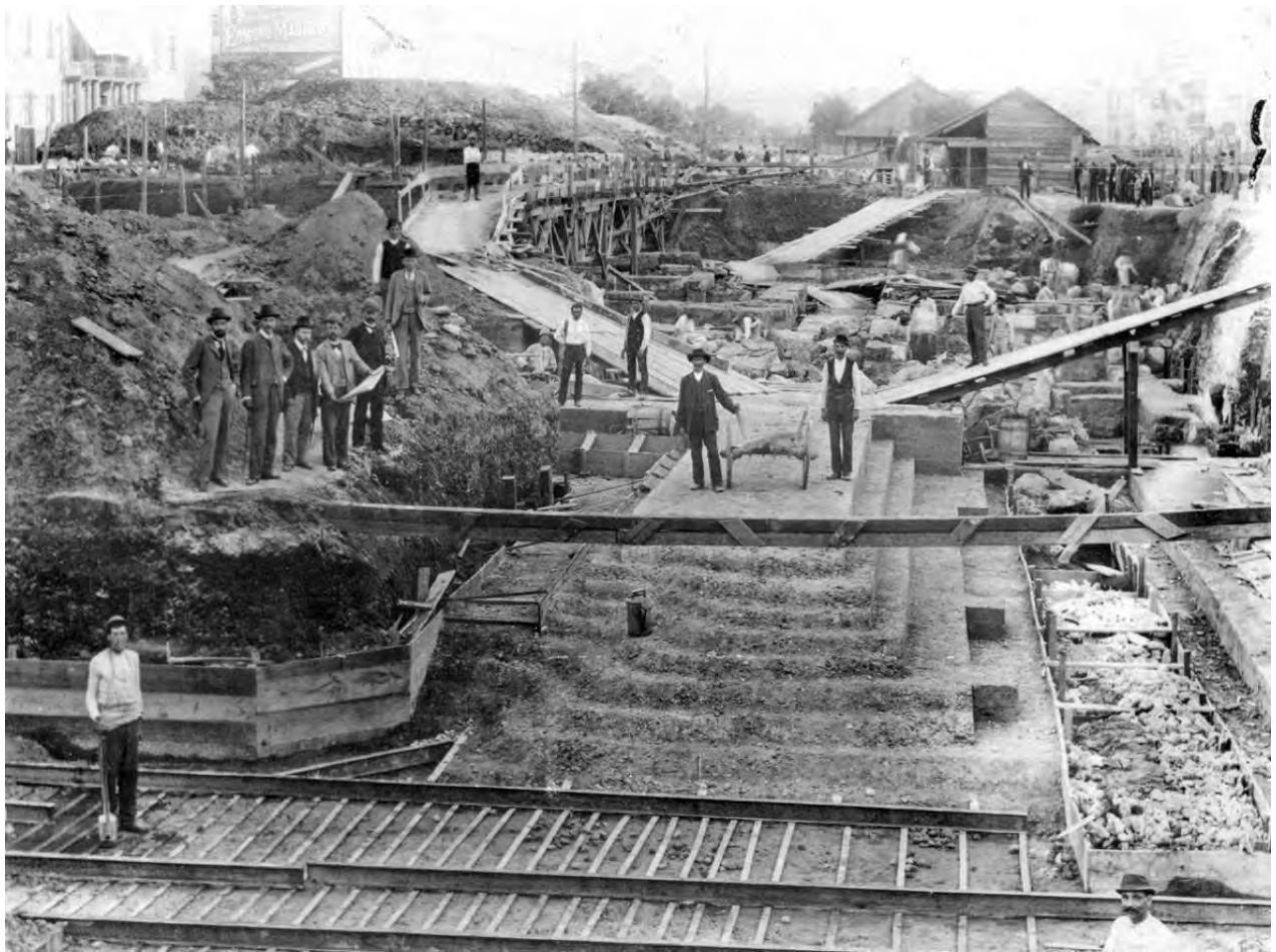
Рис. 1. Роботи з укладання фундаментів майбутнього оперного театру

Протягом усього періоду ґрунтова вода ніде не виступала на будівельному майданчику, отже, земляні розробки, як і бетонування, були зроблені повністю насухо. Після відкриття шару, на якому мали бути влаштовані проєктовані бетонні плити, всюди виявився один і той самий шар озерного мулу. Діагональною лінією через весь будівельний майданчик проходив кам'яний фундамент старих міських стін, а також ряд спорохнявілих дубових паль паралельно до стіни. Каміні були вибрані до низу, а декілька паль нижче дна фундаментів відрізані. Увесь ґрунт вирівняно тонким (декілька сантиметрів) шаром піску, який було утрамбовано і залито водою, укладений перший шар бетону товщиною 15 см, на якому укладено металеву арматуру. Нижній шар бетону до висоти 60 см був зроблений у співвідношенні 1:3:5 (цемент, білий пісок, щільний вапняк), а верхній шар, розташований вище 60 см, у співвідношенні 1:4:7. Укладання металевих стрижнів забезпечило повну однорідність і щільність плити.