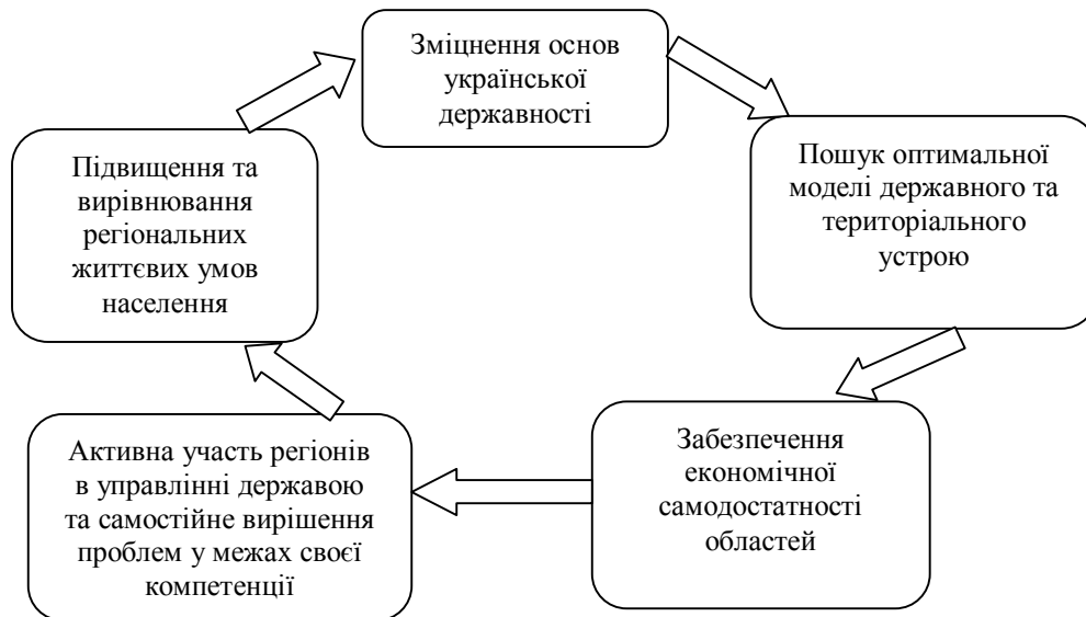
Рис. 4. Комплекс цілей регіональної політики

Комплекс цілей державної регіональної політики зображено на рис. 4 [7]. Державна регіональна політика спрямована на підвищення економічного зростання регіонів, покращення рівня життя людей, підтримку менш розвинутих територій країни.