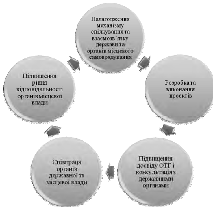
Рис. 2. Цикл співпраці держави та органів місцевого самоврядування

Варто також зазначити те, що ставлення до запровадження реформи децентралізації та створення об'єднаних територіальних громад таки має позитивну тенденцію і, на щастя, більшість опитаних все ж підтримує реформу за даними моніторингу сприйняття прогресу реформ, проведеного “Kantar TNS” для Національної ради реформ. Так, згідно з даними березня 2017 року, більша частина опитаних громадян (55 %) підтримує впровадження децентралізації, 15 % – не підтримують. Більше того, зменшилась ще й частка тих, хто повністю підтримує децентралізацію, на цілих 18 % порівняно з минулим роком. Регіональний розподіл прихильників децентралізації загалом свідчить про те, що досвід утворення об'єднаних територіальних громад (ОТГ) позитивно впливає й на сприйняття реформи загалом. Все більше і більше громадян України починають