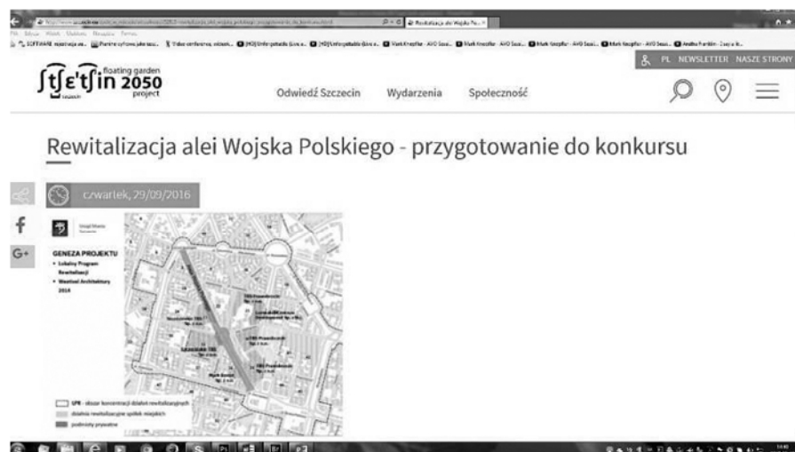
Fig. 10. City website containing the information about tender on revitalization of Wojska Polskiego Avenue.

It is not surprising that most of the citizens of Szczecin chooses the shopping centers, especially when the weather is bad. The city administration has finally noticed the issue. There is an idea to restore, at least partially, the greatness of the Avenue. The preparations for tender on revitalization of the Wojska Polskiego Avenue has already been launched (Fig. 10, 11).