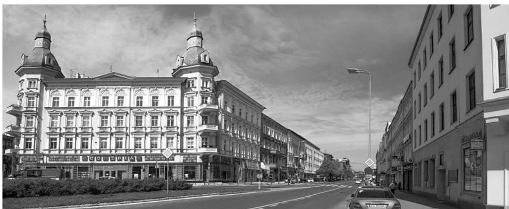
Fig. 5. View on Wojska Polskiego Avenue from Zwycięstwa Square, 2017. Source: photo by Waldemar Marzęcki

http://www.szczecin.fotopolska.euSzczecinu115240,al_Wojska_Polskiego.htmlf=95321-foto1969