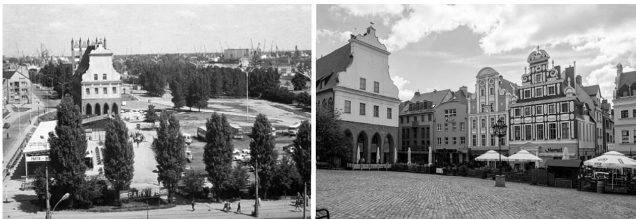
Fig. 2. Left: Development condition of the Castle borough in the '80s. Right: Rynek Sienny (Haymarket), 2017.

The issue of bombardment of the Old Town is especially important for the topic of this paper. After the War, the Old Town buildings were not reconstructed. The renovations included only a small number of surviving historical constructions, and among them the Pomeranian Dukes' Castle had a top priority. Consecutively, renaissance Loitz House and Old City Hall were renovated. The rest of the Old Town was only cleaned from the rubble and left for decades without any intervention. The upper part of the Old Town started being developed in the 1960s. The apartment housing complex was build up there. Fortunately, due to financial problems the plans for constructing four high rise buildings in the close neighborhood of the Old City Hall were dropped. Only in 1994 the development of the lower parts of the Old Town, considered as a Castle borough, started to unfold. The implementation of this construction project agreed with the compliance to historical spatial arrangement of this part of the city (Fig. 2, 3).