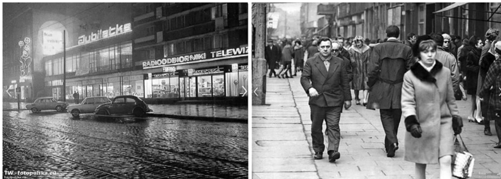
Fig. 4. View of Wojska Polskiego Avenue, 1965–70.