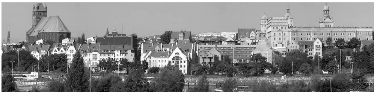
Fig. 3. Panoramic view on developing borough in Szczecin.

The area of the Old Town is mostly filled with modern buildings inspired by historical developments. As opposed to previously mentioned developments in the upper part of the Old Town, the lower part is mostly developed in a close compliance to the former old-town arrangement. A part of the Old Town was however set for infrastructure investments. Most of the free spaces of the Old Town and Rynek Sienny (Haymarket) are nowadays developed. The residents of Szczecin are more and more aware of this place. For almost 49 years Szczecin was deprived of its historical heart. This influenced the behavior and perception of the citizens. The lack of the Old Town resulted in a creation of a different center located along the Wojska Polskiego Avenue. The part of the longest street in Szczecin, between the Szarych Szeregów Square and Zwycięstwa Square, started to be the meeting place thanks to existence of the exclusive boutiques, restaurants and coffee shops. Taking a walk on Wojska Polskiego Avenue was viewed as a good taste (Fig. 4, 5).