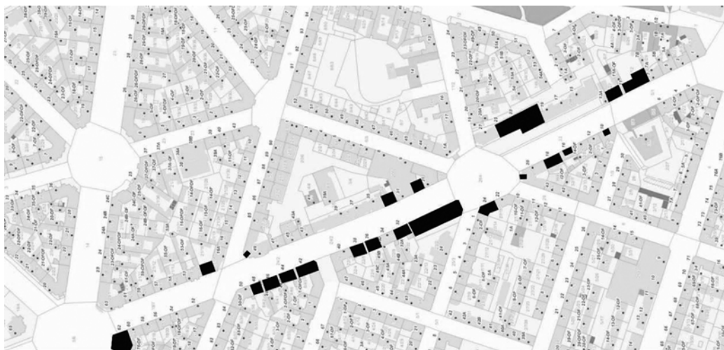
Fig. 6. Wojska Polskiego Avenue. Black spots mark shops for rent or sale.

After the political transformation in 1990, Poland started to undergo dynamic changes. The shops on Wojska Polskiego Avenue were overflowed with western merchandise. On a long run however, the political transformation meant a death to the shops. Suddenly the Wojska Polskiego Avenue started to die slowly. One shop after another was being closed. Only “For Rent” and “For Sale” signs decorated the windows of the shops. The approximate number of closed shops on the Wojska Polskiego Avenue was made (as of 20.06.2017) and is presented on the photos below (Fig. 6, 7):