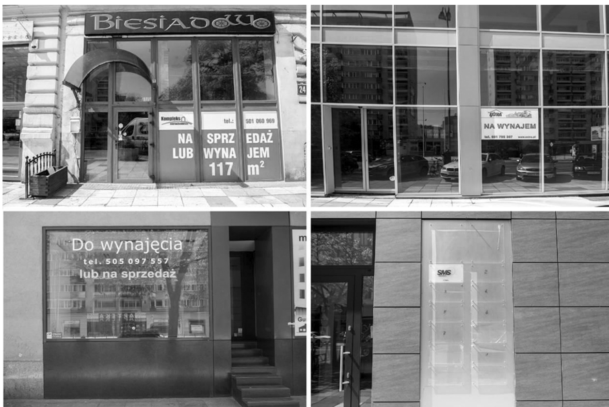
Fig. 7. Examples of business premises for sale or rent.

The demand for rental and selling of the businesses was so great that one of the real estate companies opened their office there to provide the services (Fig. 8).