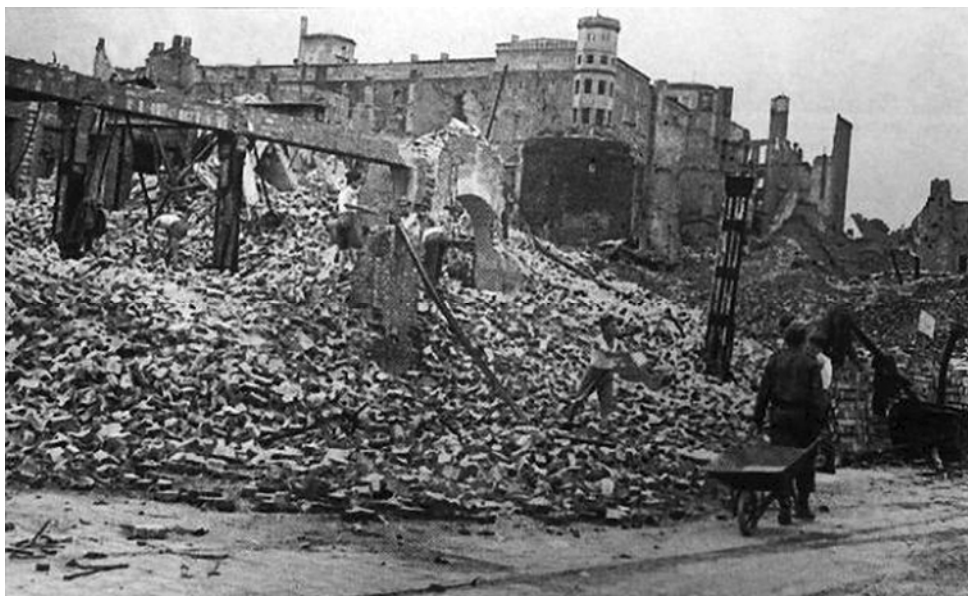
Fig. 1. A view on a bombed Castle borough. In the back Pomeranian Dukes’ Castle in Szczecin.

Szczecin during the Second World War was a target of intense Allies bombardments. As an important industrial center, especially considering the existing harbour, it was particularly exposed to attacks. As a result, majority of the city infrastructure was destroyed, including almost 90 % of the Old Town (Fig. 1).