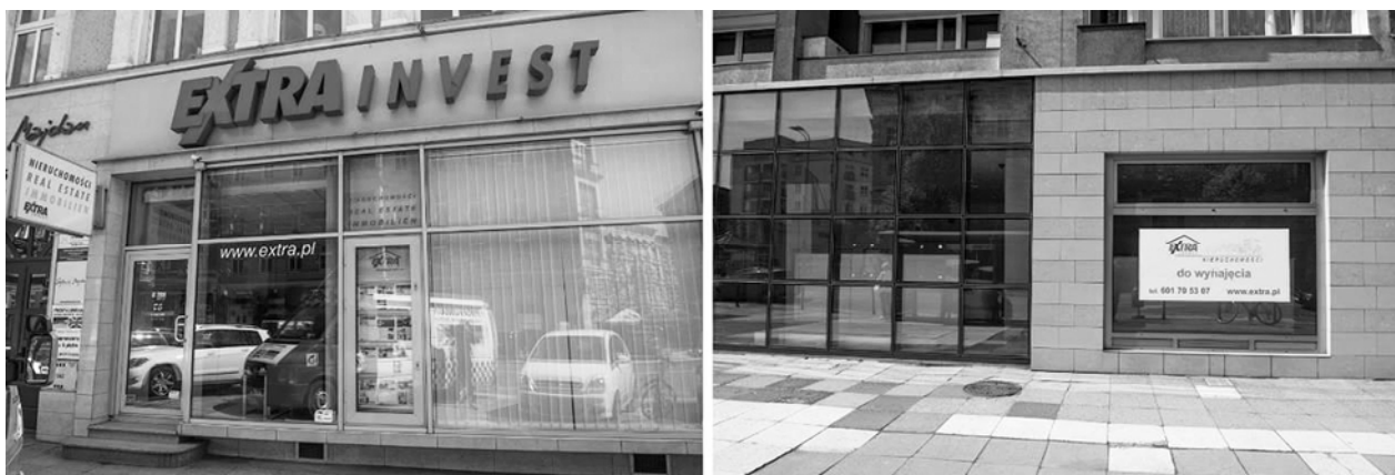
Fig. 8. Left: Real estate office on Wojska Polskiego Avenue providing rental and sale services. Right: One of numerous business in the real estate company's offer.

The demand for rental and selling of the businesses was so great that one of the real estate companies opened their office there to provide the services (Fig. 8).