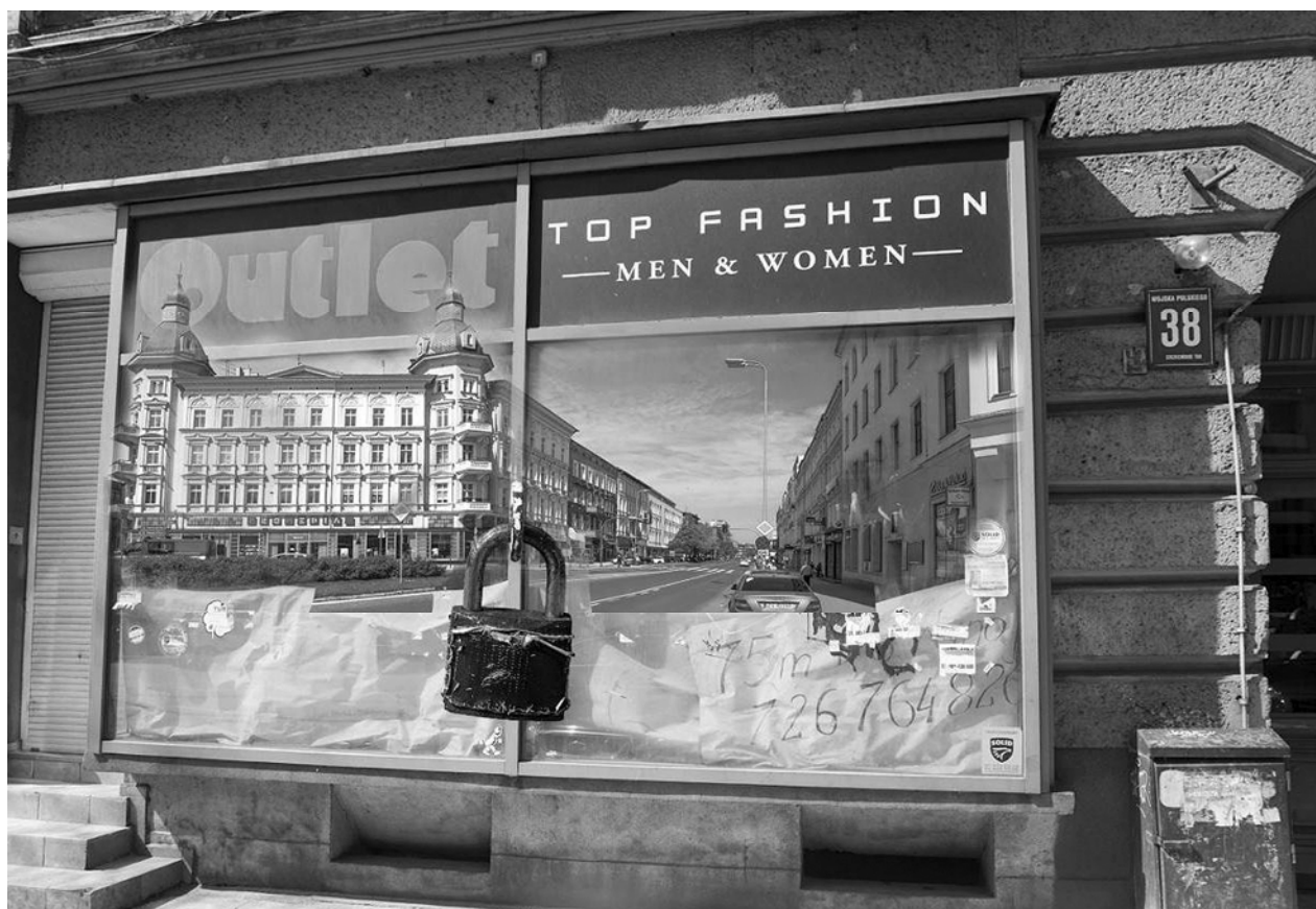
Fig. 11. Photomontage dedicated to dying of the Wojska Polskiego Avenue.

But is it really possible? Can we repair the damage done not only to Wojska Polskiego Avenue but also the whole neighbourhood shopping area in Szczecin that was destroyed by the unfavourable location of big shopping centres in the very heart of the city?