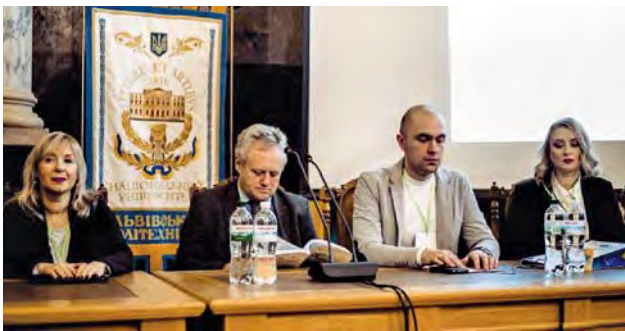
Президія Міжнародної науково-технічної конференції молодих вчених "GeoTerrace-2018"