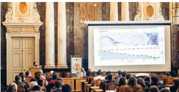
Пленарне засідання в актовій залі головного корпусу Національного університету "Львівська політехніка"